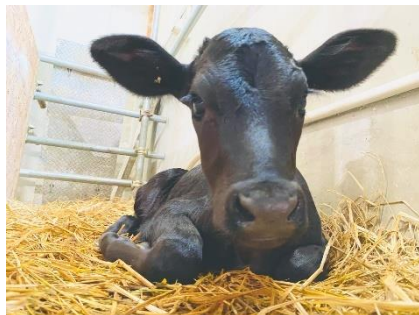
↑今回生まれたナメコ。

ナメコの名前の由来について聞いてみました。「交雑種(ミックス)の牛はネバネバ系の名前にするという決まりがあります。その決まりと見た目の色からナメコという名前に決めました。」だそうです。新しい仲間が生まれたら、また紹介したいと思います。