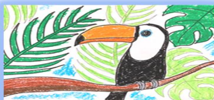
南国植物とオオハシ鳥

季節は進み、早めに訪れた暑さの影響もあってか、一学期の授業の中で種から育て観察を続けている植物たちが、グングン成長している様子です。梅雨が明けると夏本番が訪れ、暑さが更に増すと思われますが、花や実が育つ次の時季を、また心待ちにしたいと思います。