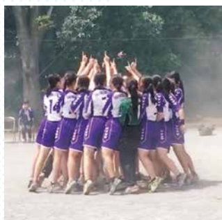
女子ハンドボール部