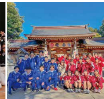
男子ハンドボール部