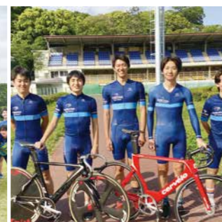
自転車競技同好会