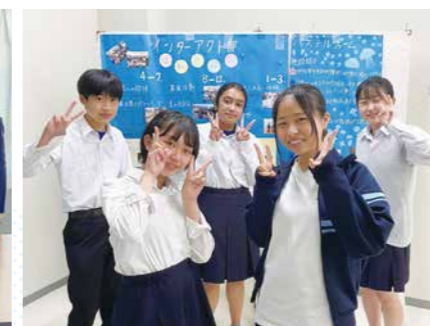
インターアクト部