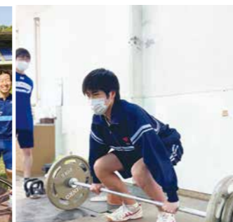
ウェイトリフティング同好会