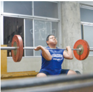
ウェイトリフティング同好会