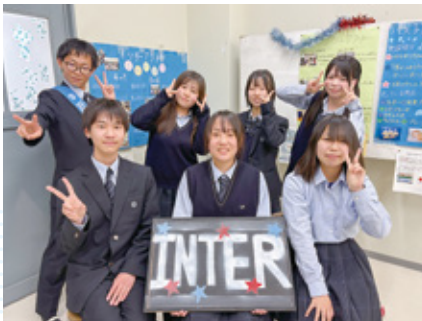
インターアクト部