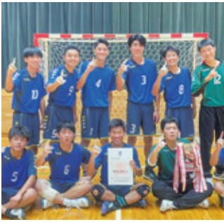
男子ハンドボール部