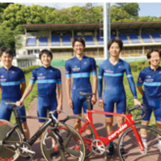
自転車競技同好会