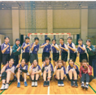
女子ハンドボール部