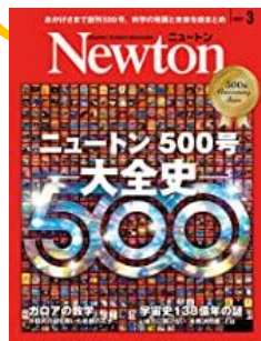
ニュートンプレス