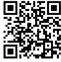
厚生労働省相談窓口