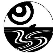
←茅ヶ崎支援学校の校章です。烏帽子岩がデザインされています。