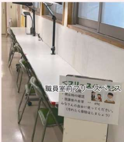
職員室前フリースペース