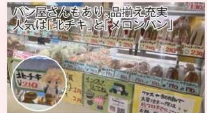
パン屋さんもあり、品揃え充実 人気は「北チキ」と「メロンパン」