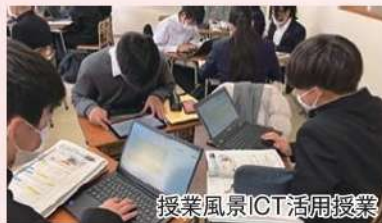
授業風景ICT活用授業