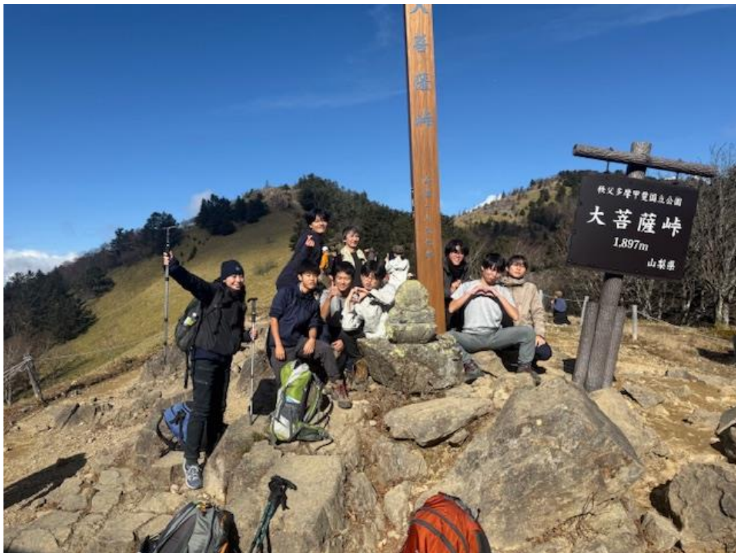
入山後約 60 分強で最初のランドマーク・大菩薩峠に着きました。この景色はインターネット上でもよく取り上げられています。