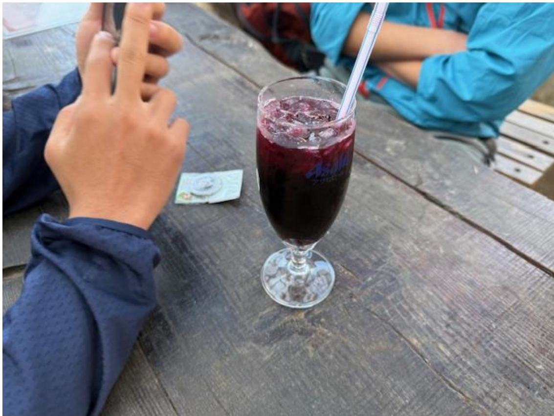
ぶどうジュースをオーダー。