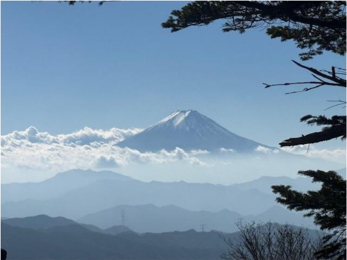
高度 2,000m 地点に差し掛かったところで富士山が姿を見せ始めました。日本映画のワンシーンみたいですね。