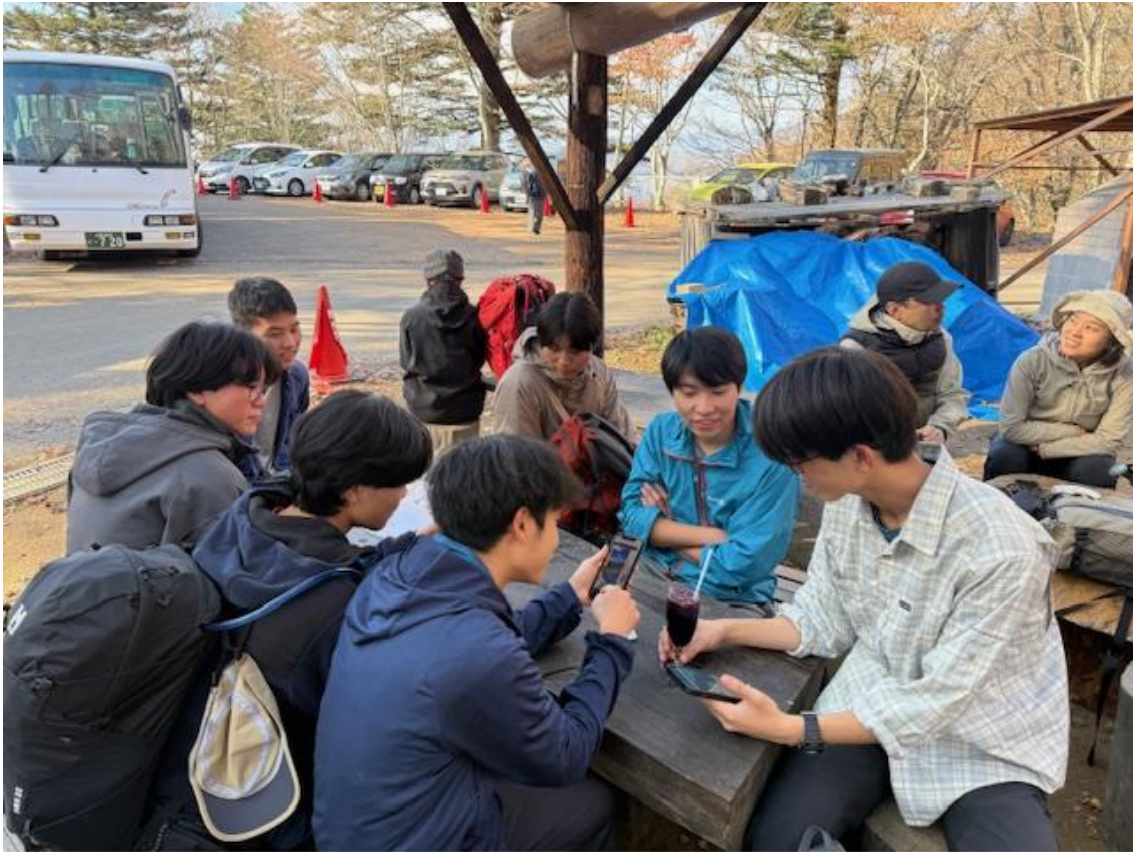
13:30 無事下山。バス停前のロッジ長兵衛で歓談タイム。