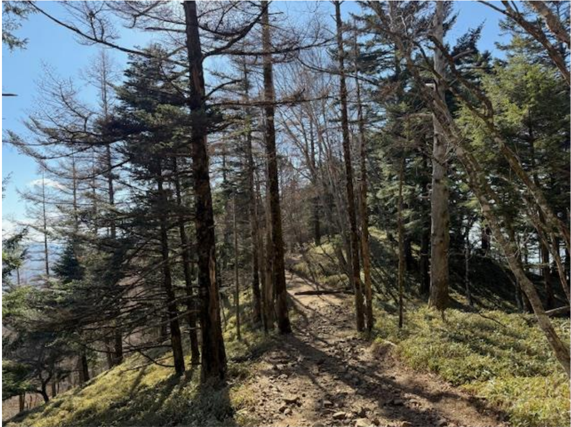
日本離れをした風景ですね。