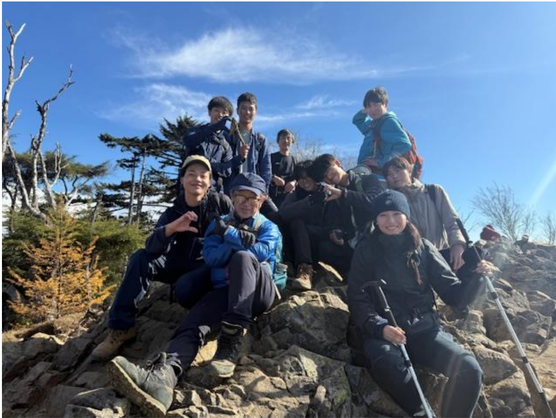
大菩薩嶺山頂手前の雷岩（かみなりいわ）にて。