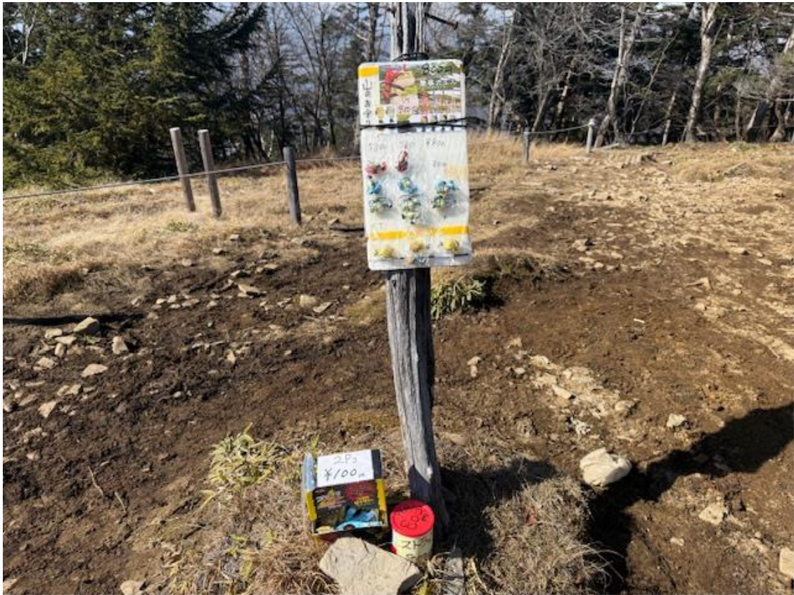
大菩薩嶺記念グッズとチョコレートの無人販売。