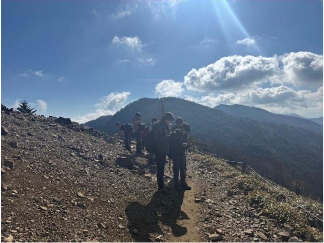
2年生部員は歩きながら写真撮影に興じています。