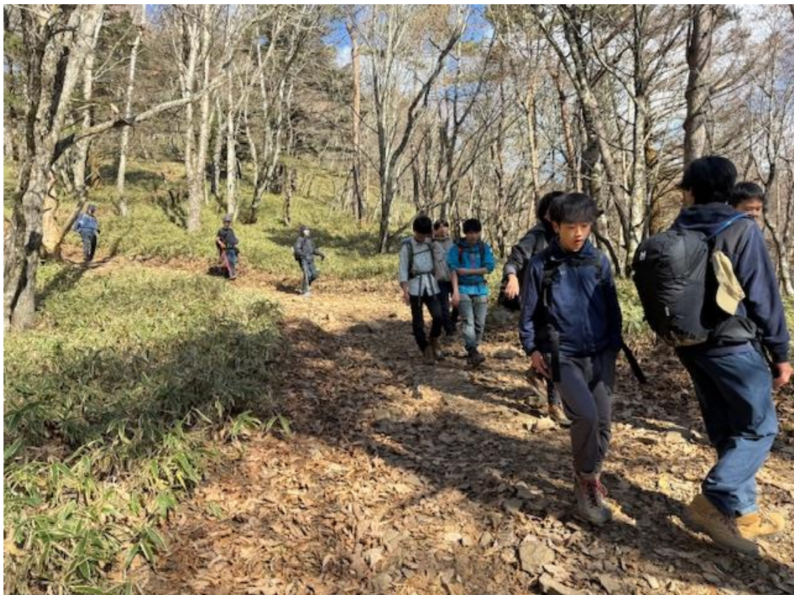
下り始めは急な山道でしたが、それが終わるとなだらかな登山道を下っていきます。