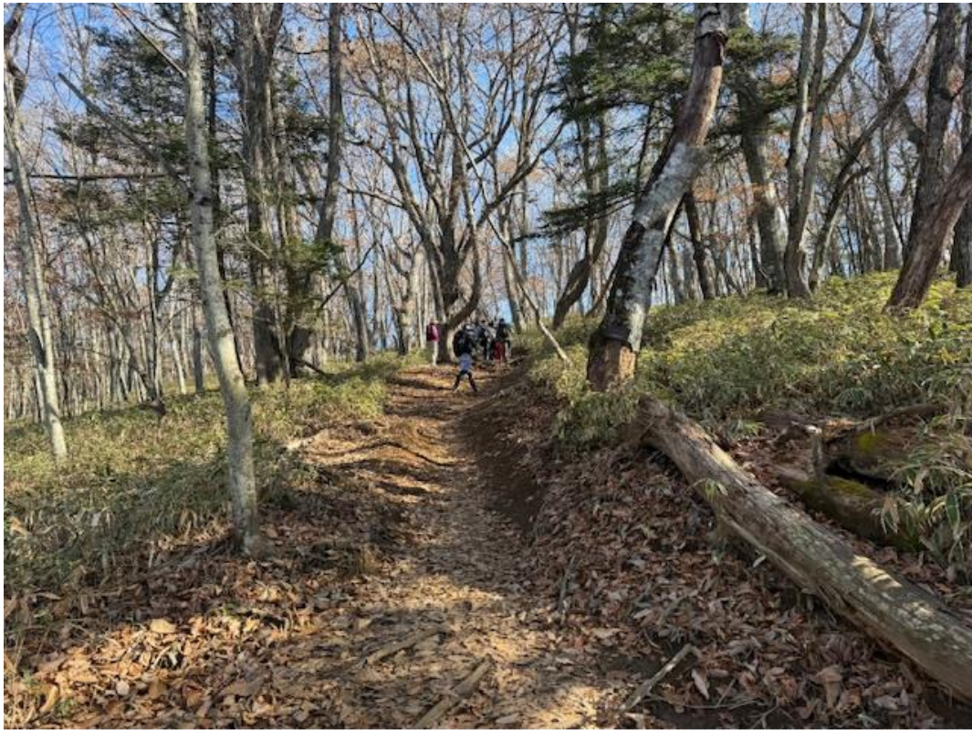
登山口着後、入山。山は冬支度を始めていました。落葉が進んでいます。