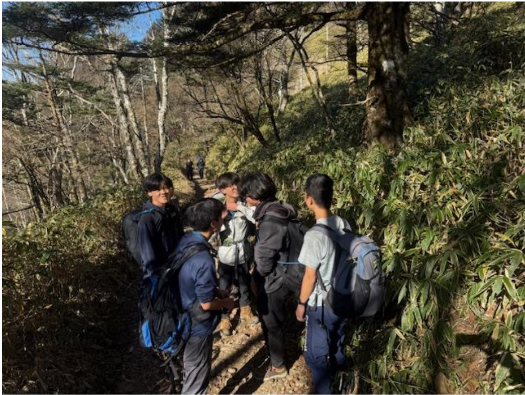
歩き出しの最初は寒いのですが、だんだん体が温まってきました。中にはTシャツ1枚になる人も。