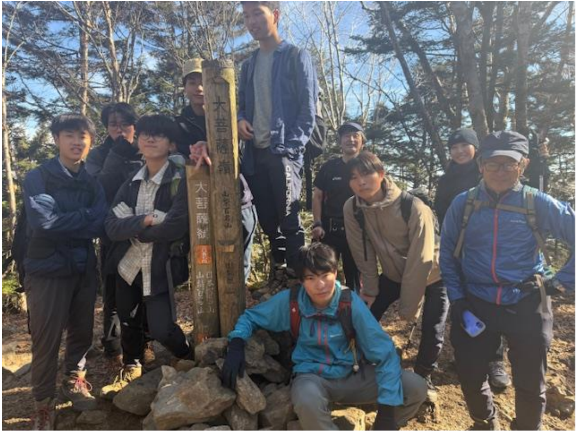
大菩薩嶺山頂に到着。眺望が良くないため雷岩まで戻って昼食を摂りました。