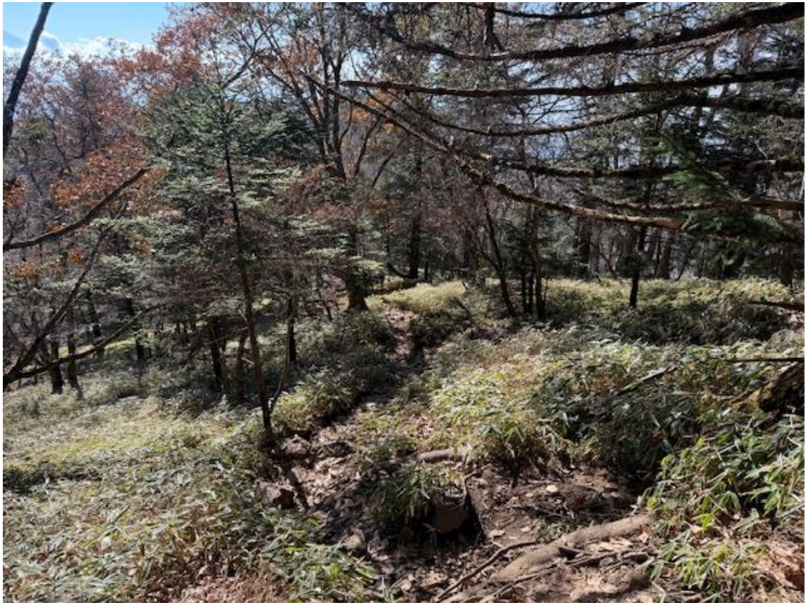
下山は唐松尾根を下りました。唐松尾根というだけあって針葉樹林が目立ちます。