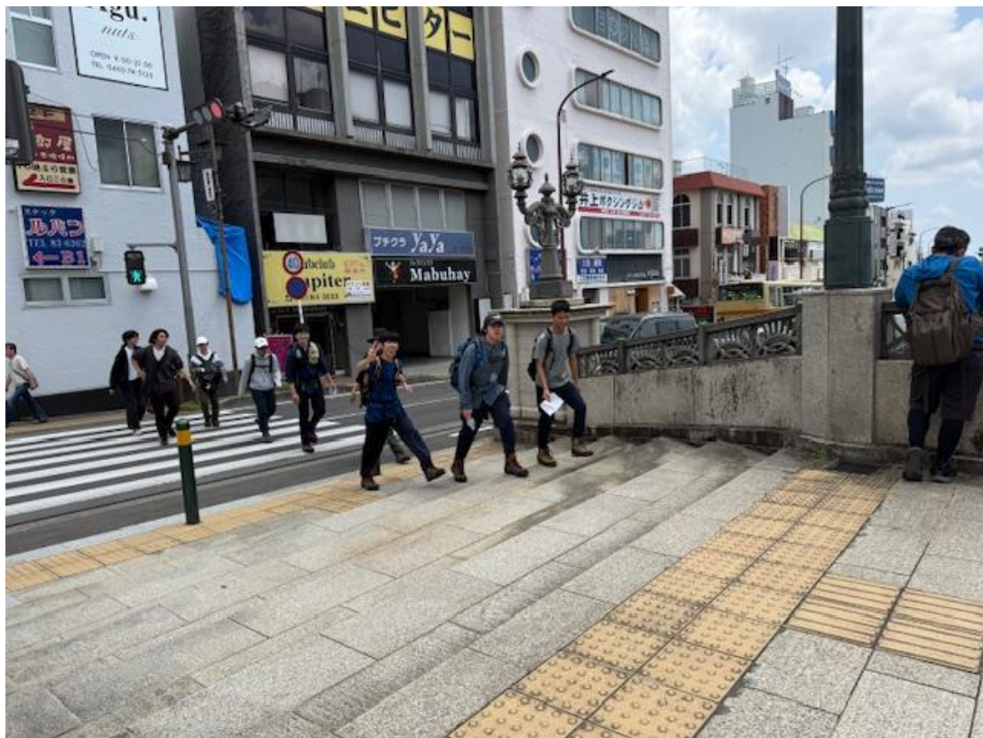
弘法山下山 秦野駅で解散しました。

天気に恵まれていたせいか、道中多くのハイカーとすれ違いました。この時期の登山は本当に気持ちがいいです。