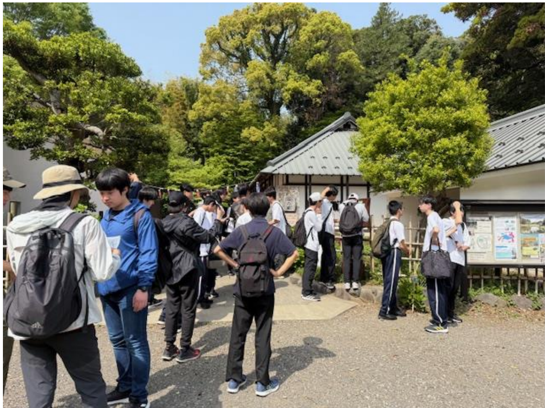
里山公園内を散策

里山公園で各自顔合わせと自己紹介をするのが北陵ワングルの恒例行事とのこと。新メンバーには一日も早く慣れてほしいものです。