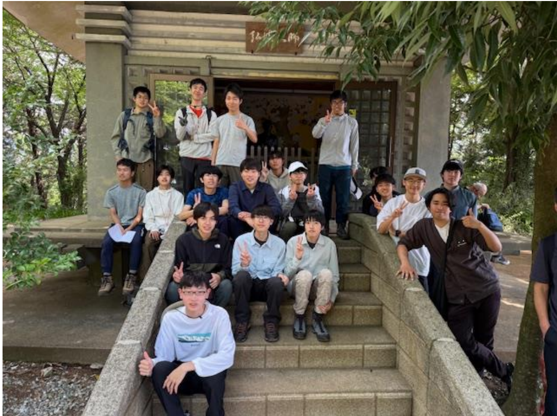
弘法山山頂のお堂で記念撮影