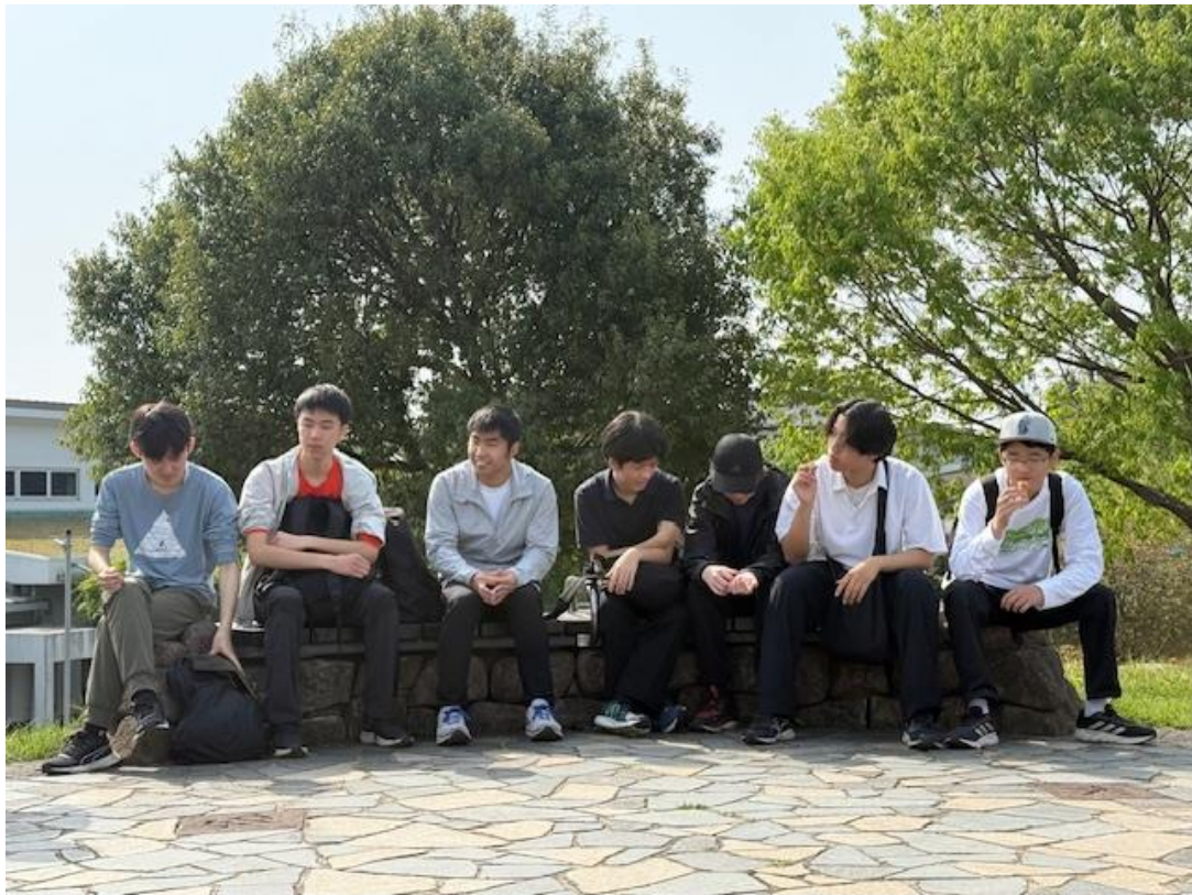
3年生 もう大人の余裕

里山公園で各自顔合わせと自己紹介をするのが北陵ワングルの恒例行事とのこと。新メンバーには一日も早く慣れてほしいものです。