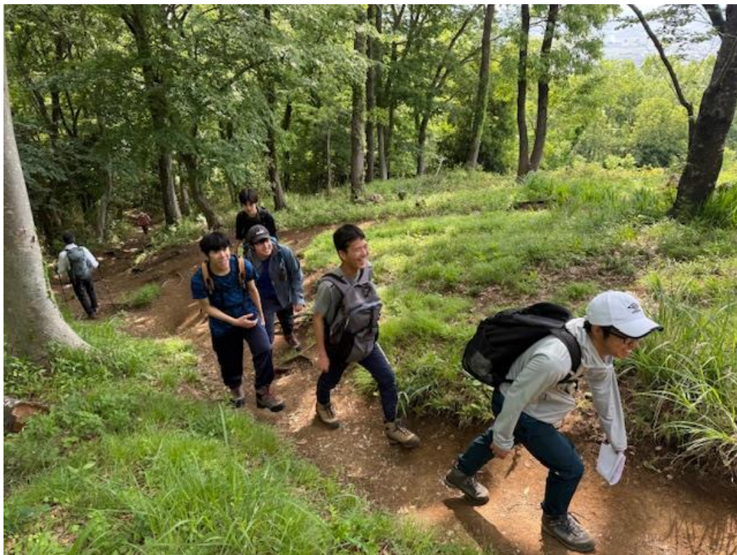
歩行中も和気あいあいでした。