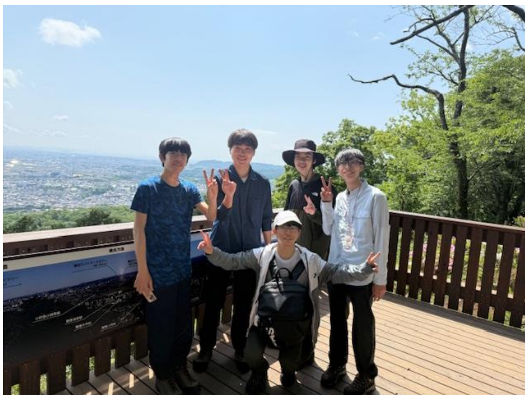
弘法山その１ １年生の仲間たちも打ち解けてきたようです。