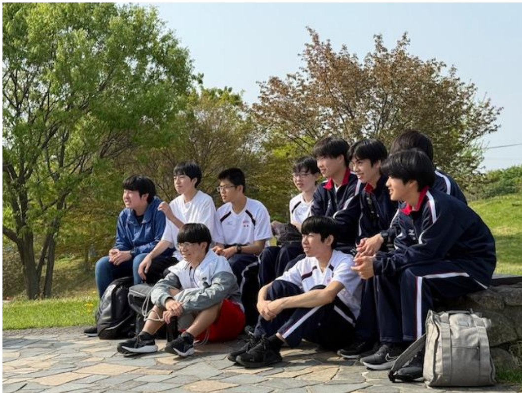
今年の新1年生 ジャージ姿が初々しいです。