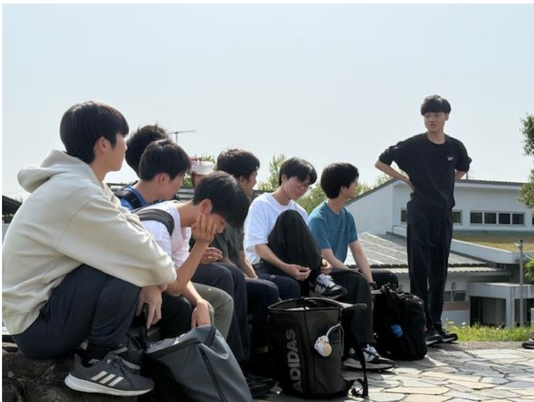
2年生 後輩が入ってきて先輩の自覚が少しずつ出てきたかな？