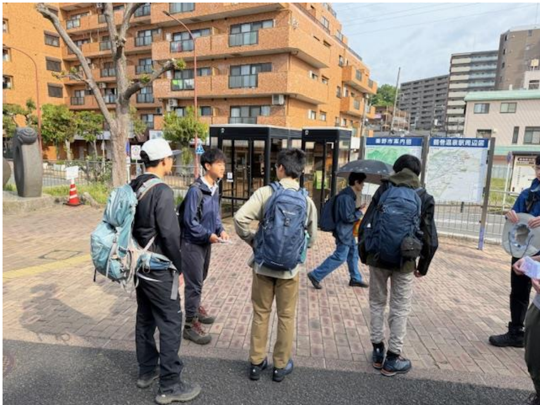
鶴巻温泉駅で班分けをしたのち出発