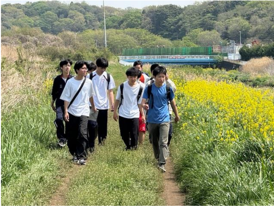
帰りのコースでは菜の花が咲き乱れていました。すっかり春の装いです。