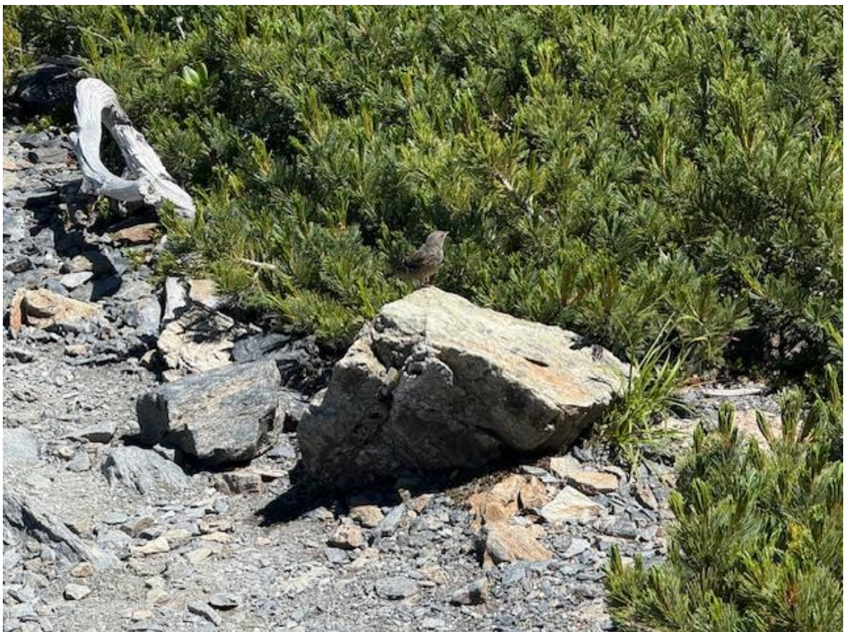
肩の小屋付近にいたイワヒバリ（画像中央）

去年は瑞牆山（みずがきやま）名物の瑞牆ブルーの撮影に成功しましたが、今年は北岳ブルーの撮影に成功。空が近くて気持ちがよかったです。