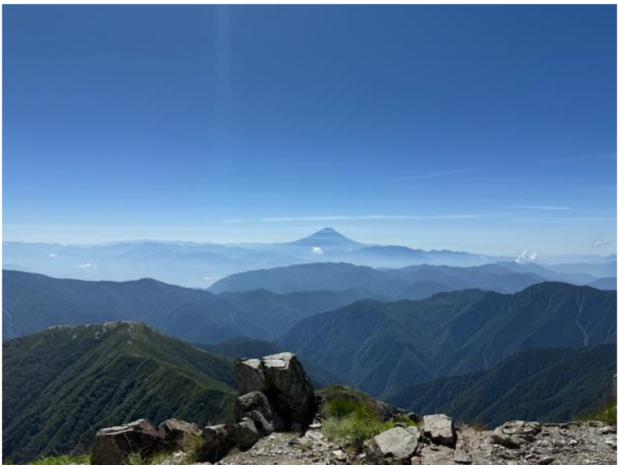
富士山 実物はこの倍近くの大きさに見えます。