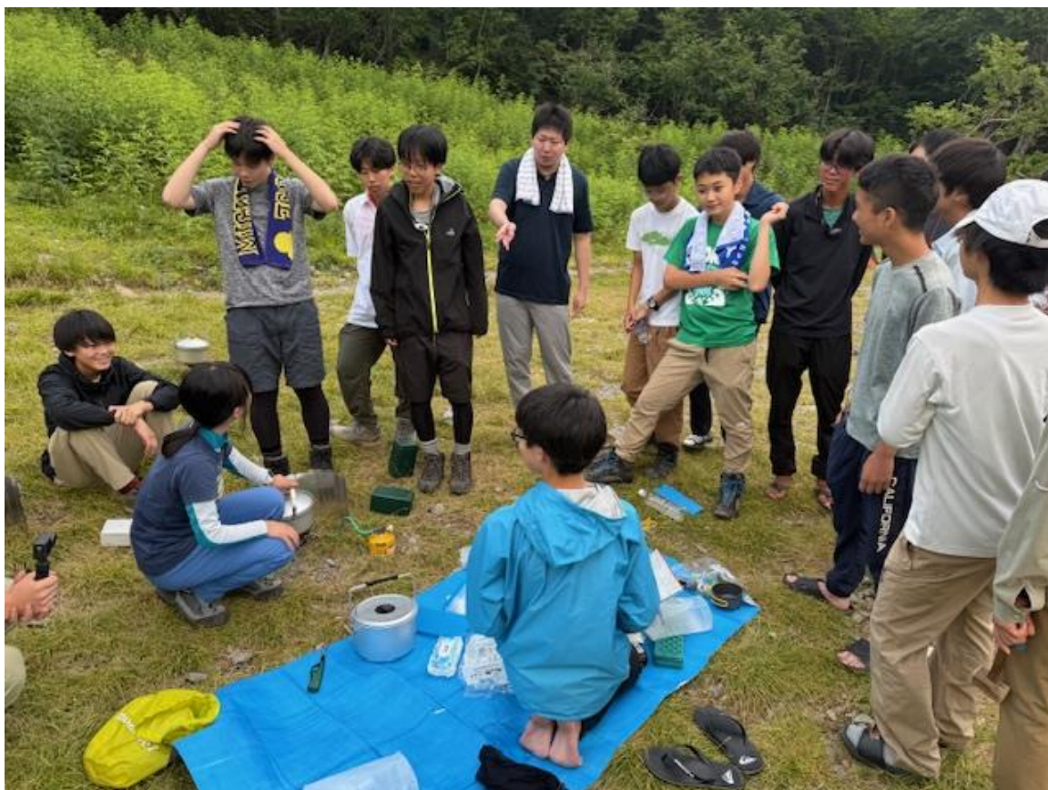
北陵ワングルのすぐ横で平塚中等教育学校山岳部が幕営をしていました。お互いに食事内容の情報交換がスタートしました。