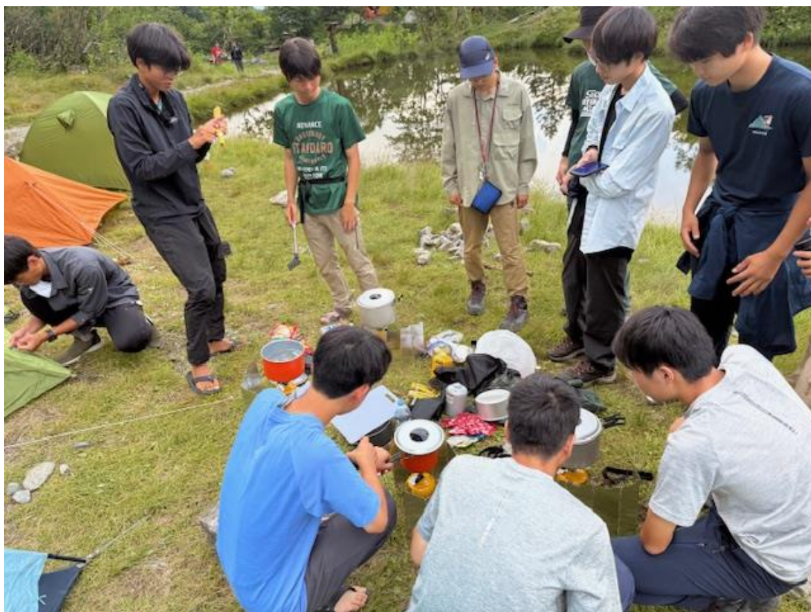
北陵も夕食準備です。できあがったのは…