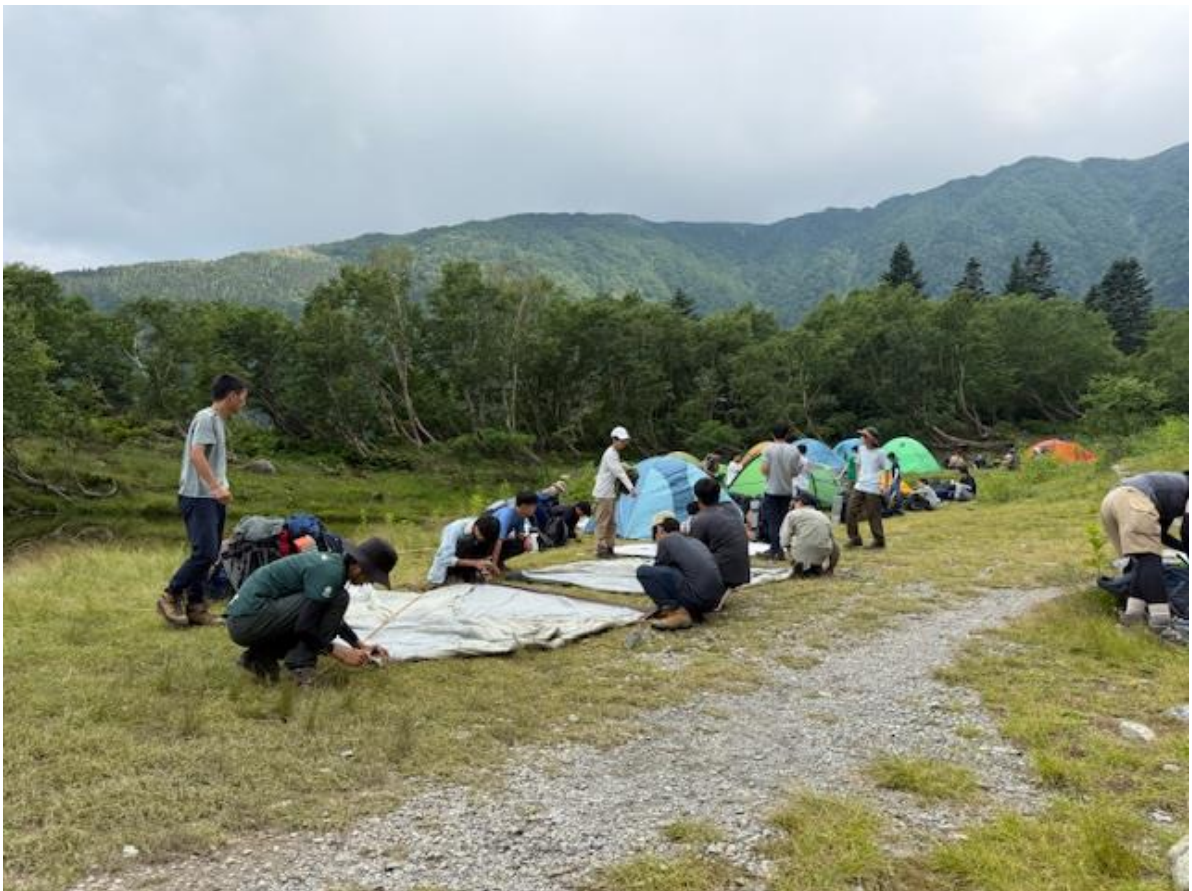
入山から4時間。幕営地の白根御池に到着。酸素が薄くなり、息苦しさや軽い頭痛を訴える生徒も散見されました。