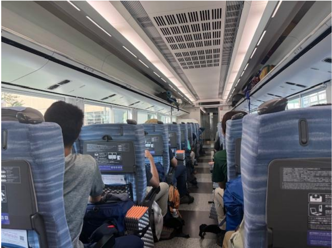
車内では本を読む人や寝る人などリラックスモード。