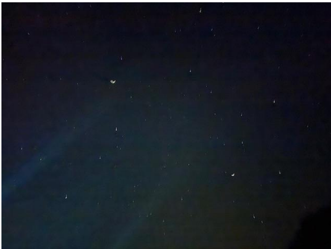
空を見上げると満天の星空。コンディションに期待が高まります。