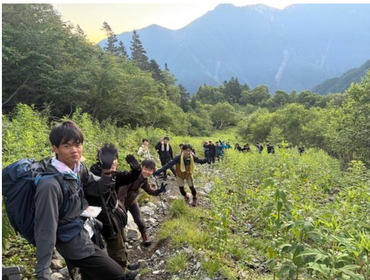
余裕をもって準備し、4：30 入山。幕営地の目の前が登山口になっていて、いきなり登りからスタートです。