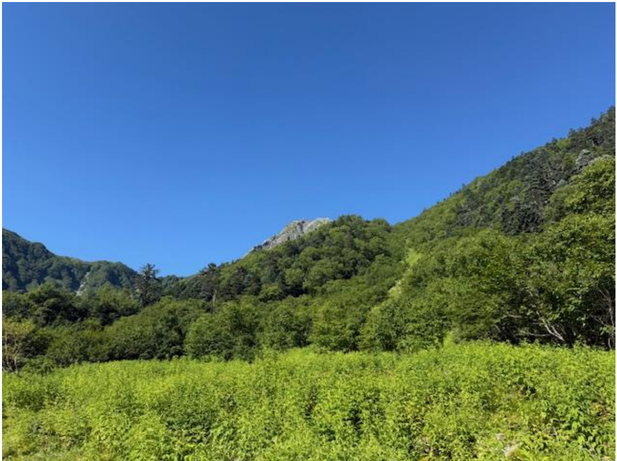
7:30 白根御池に別れを告げました。