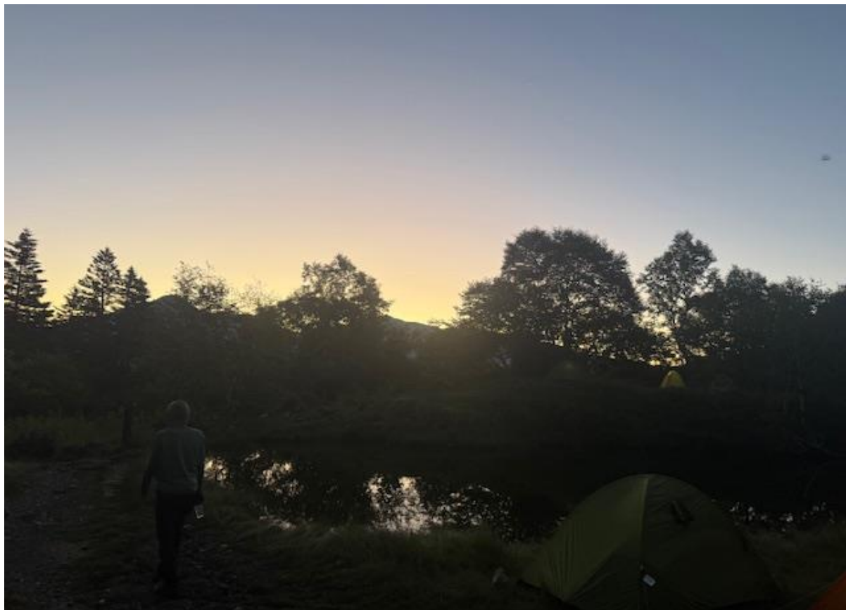
朝4時の白根御池です。下山するだけなのでゆっくりめの起床です。