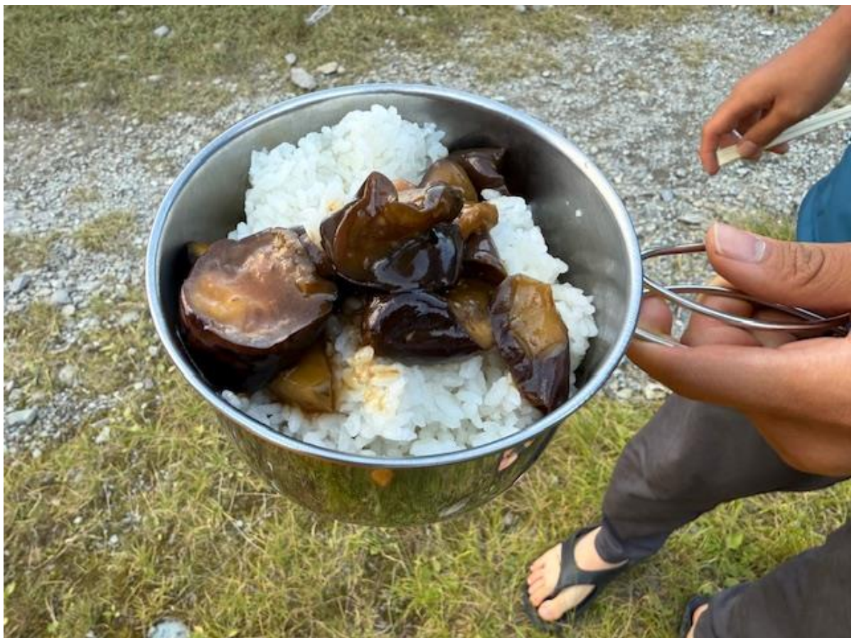
今日の山メシは麻婆茄子。