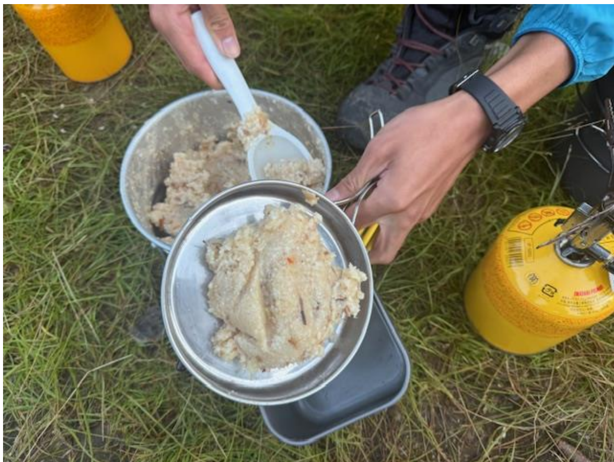
最後の山メシは炊き込みご飯でした。時短を狙って前日に炊飯。当日朝に水を少し入れて温めなおしたものです。お味のほどは…？