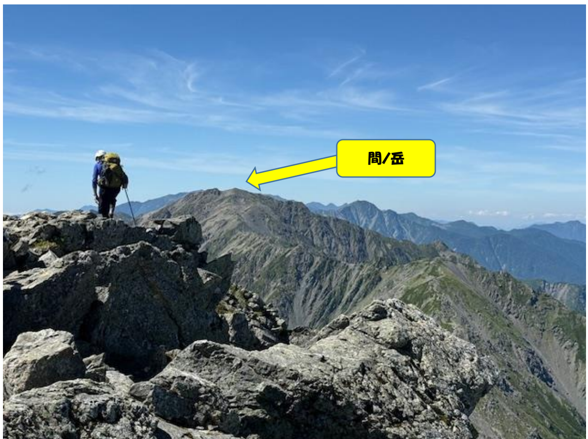
尾根の頂上が日本 No. 3 の標高を誇る間ノ岳（あいのだけ）。北岳より先も天空の縦走路が続きます。