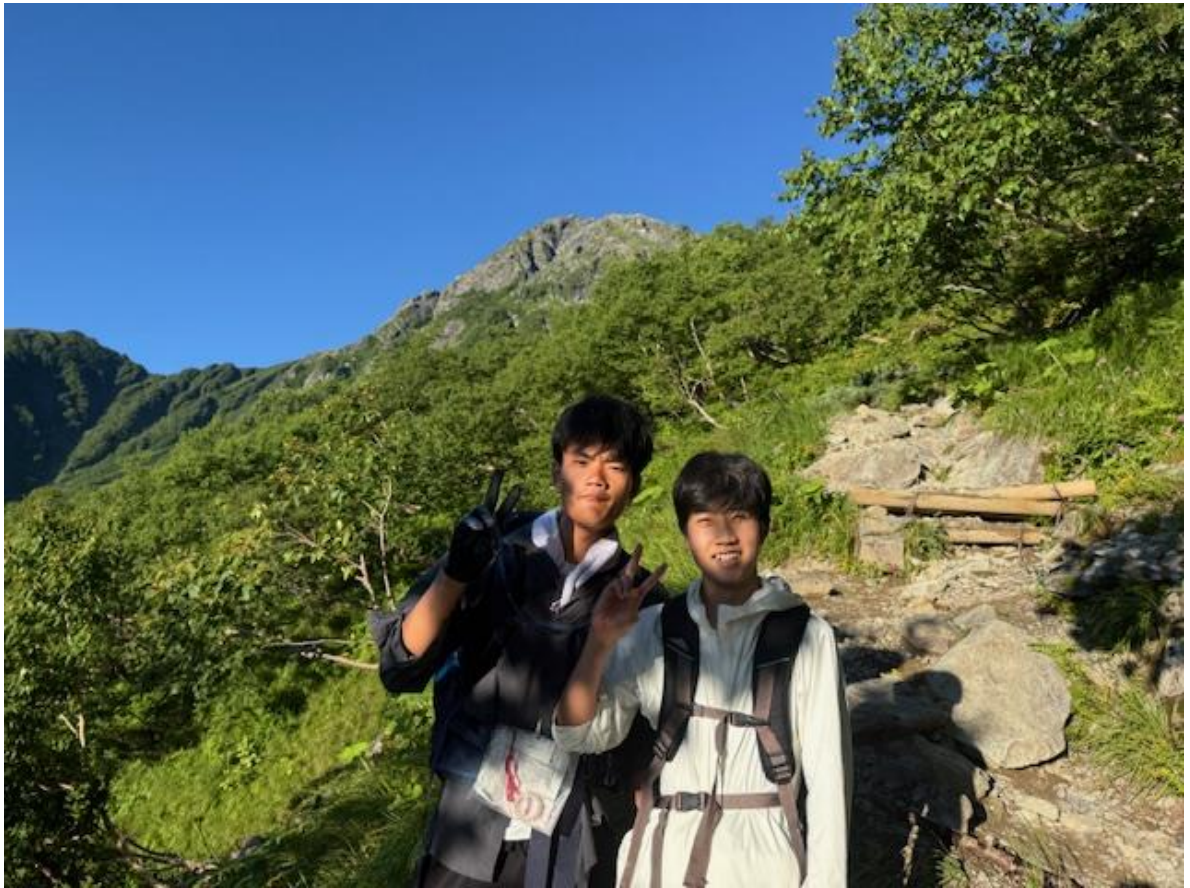
北岳をバックに記念撮影。空気がだんだん薄くなり、高山病の症状が出始めた生徒もいました。この時点で標高2,500m 近辺。