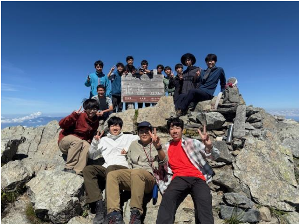
日本 No. 2 の標高を誇る北岳登頂！ 3,193m