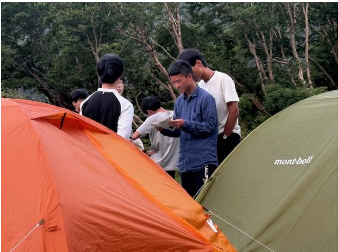
夕方小田原高校山岳部が白根御池に到着。小田原高校が挨拶にきたところで山行計画書の交換をとおして交流スタート。フィールドに出ればみんな仲間で、それが登山の一番の魅力だと思います。Day 3につづく…