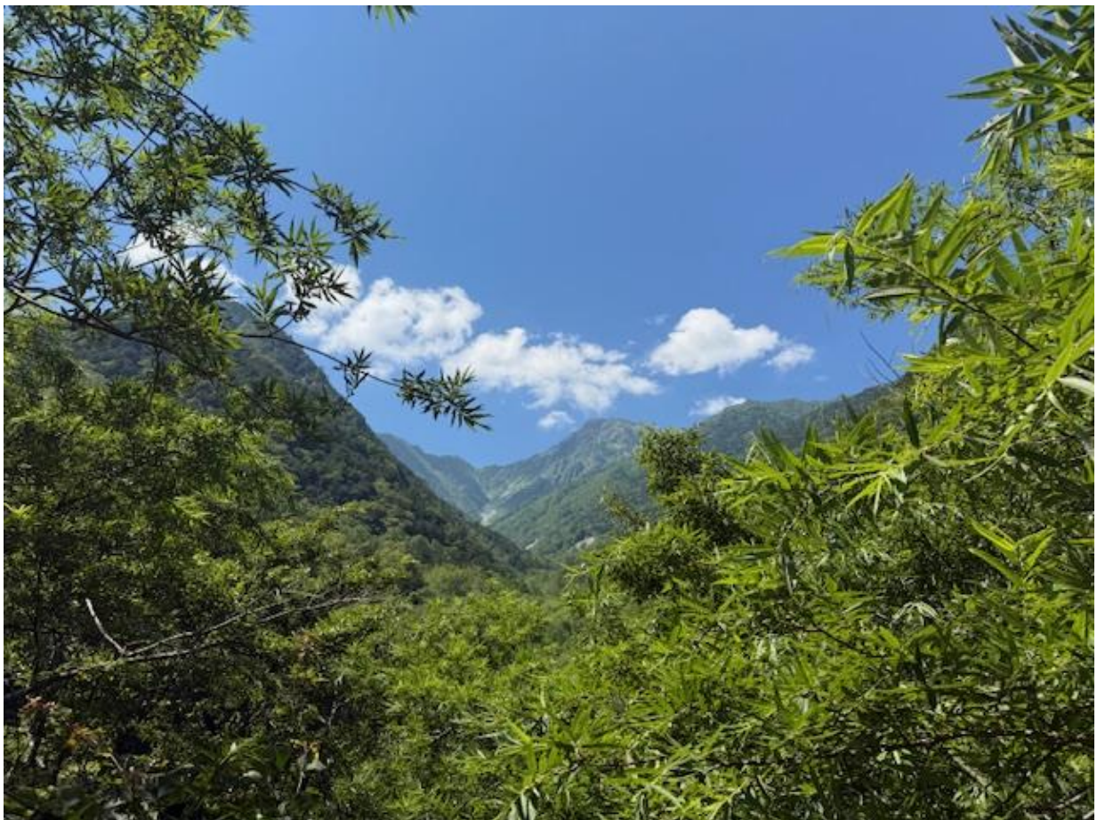
降下すること3時間。広河原バス停に到着。広河原から見た北岳です。遠い…