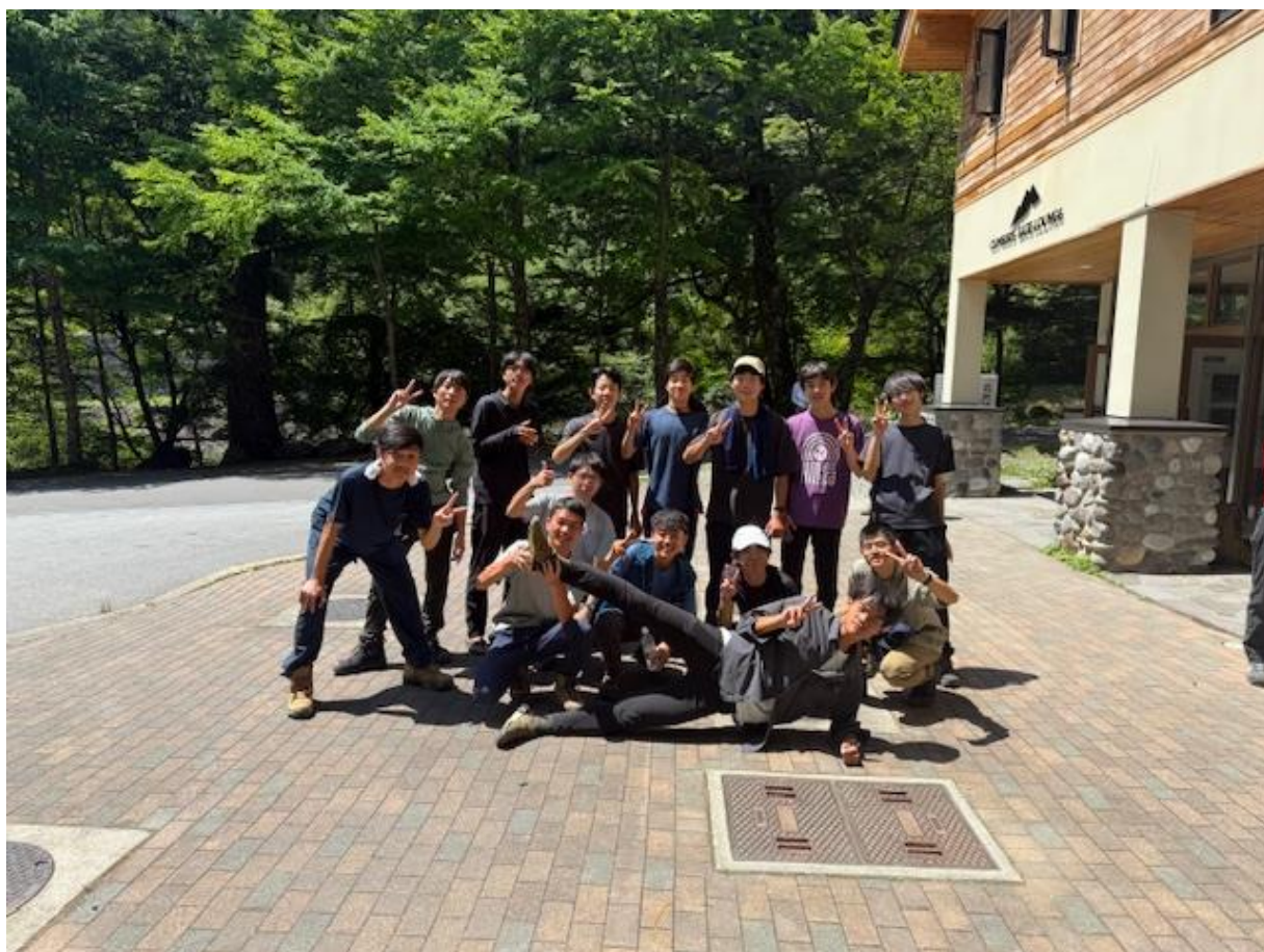
無事全員下山完了。お疲れさまでした。来年の夏合宿はどこになるのかな？