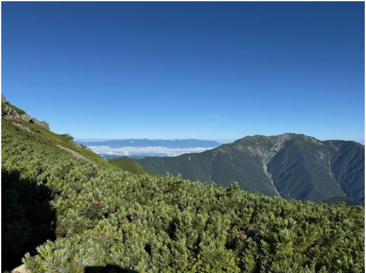
小太郎尾根から南に続く尾根は日本で一番平均高度が高く、「天空の縦走路」と言われています。北岳手前の肩の小屋を目指す間では「南アルプスの女王」と言われる仙丈ヶ岳を見ることができました（画像右手）。