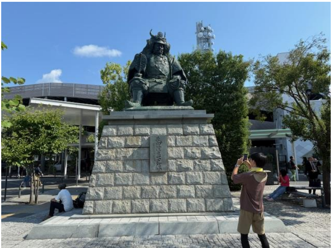
甲府駅前の武田信玄像。安全登山を祈念して…