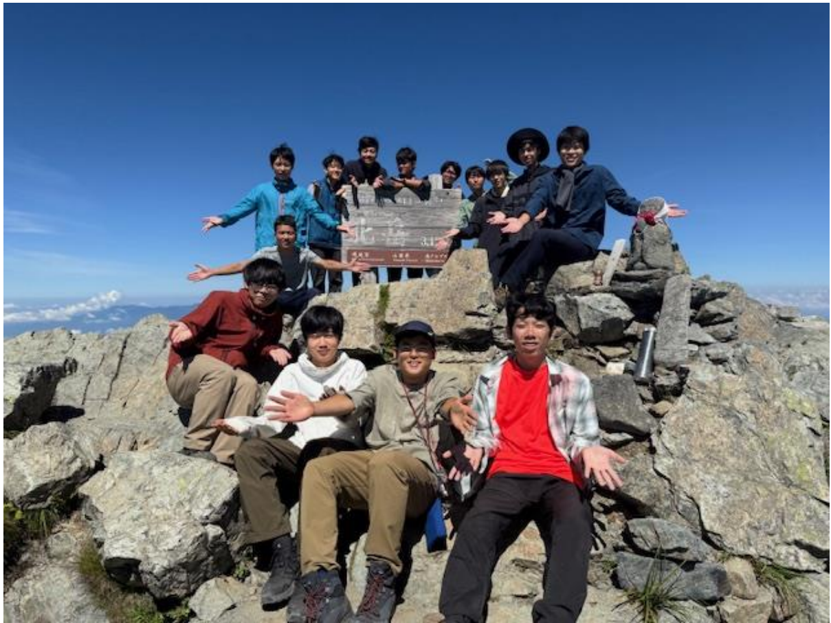
「いよ～、す〇ざんまい！」のポーズ。