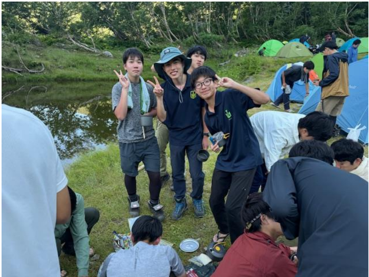
平塚中等の生徒が遊びにきました。