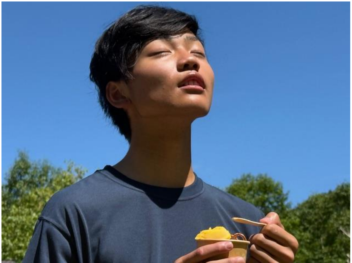
山小屋で売っていたアイスを掻っ込みます。「ちょ〜最高！」