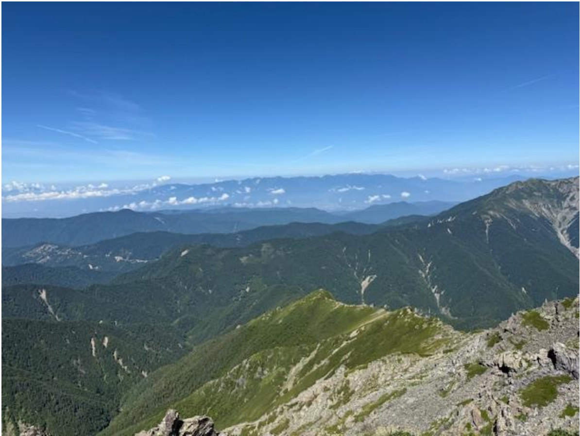
はるか彼方には北アルプス