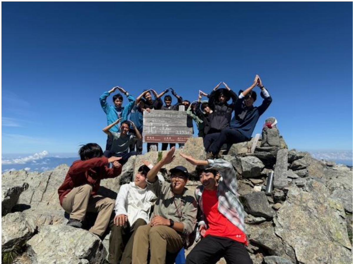
山のポーズ（登山者の間ではこれが共通認識なんだそうです）。