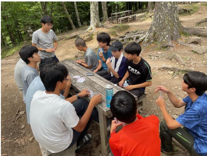
↑ 昼食後、トランプ大会スタート