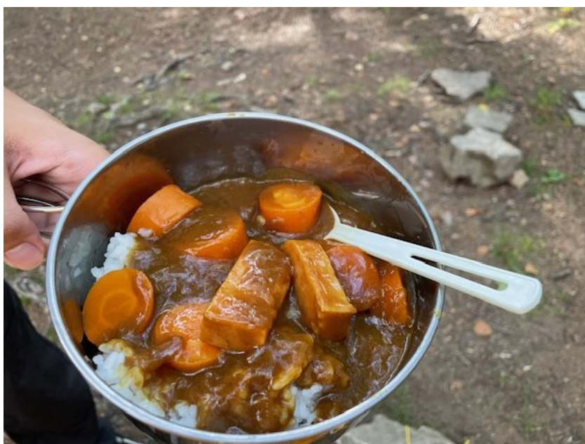
↑ 北陵山メシ 2024 スパム入りカレーライス

材料／カレールウ・ジャガイモ・人参・スパム ※白米はもちろん鍋で炊き上げました。