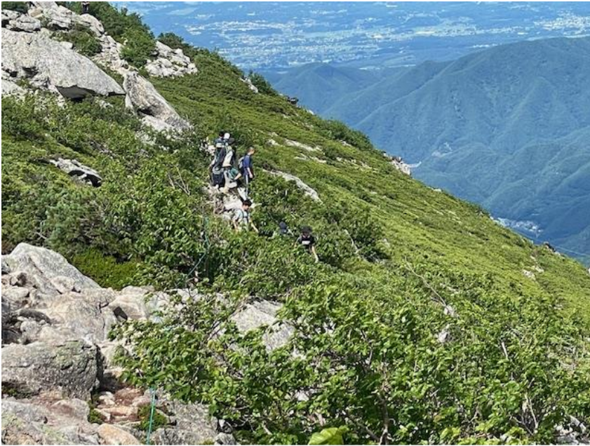
↑ この登山道で標高は 2,500m を越えています