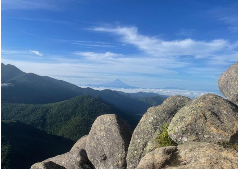
↑ 瑞牆山山頂より富士山を望む