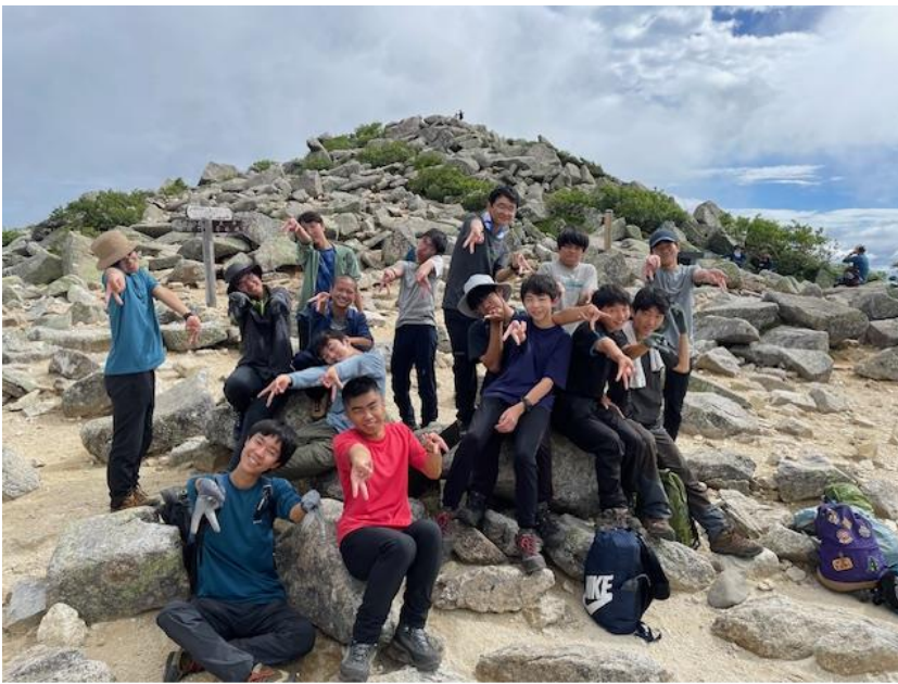
↑ 8時30分 金峰山登頂成功

この日は帰着後に土砂降りに遭い、テントの浸水の対応をしたり本来作るはずだったチャーハン を非常食(カップ麺やパン類)に切り替えたりとバタバタした一日でした。就寝は19時30分。