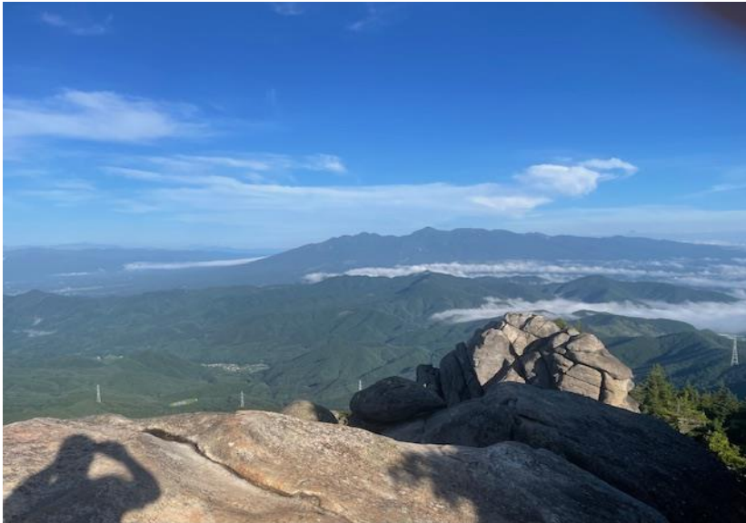
↑ 画像奥に見えるのは八ヶ岳