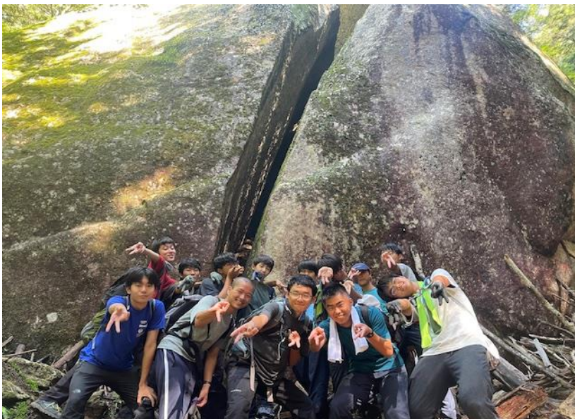
↑ 帰り道に桃太郎岩で写真撮影