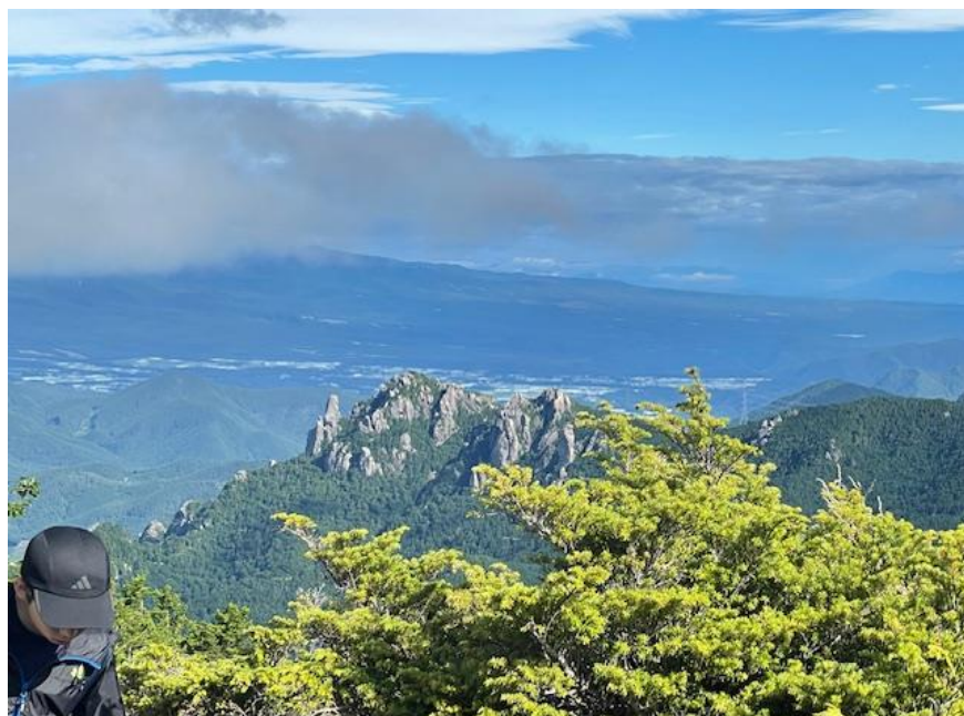
↑ 金峰山に向かう稜線から見た瑞牆(みずがき)山