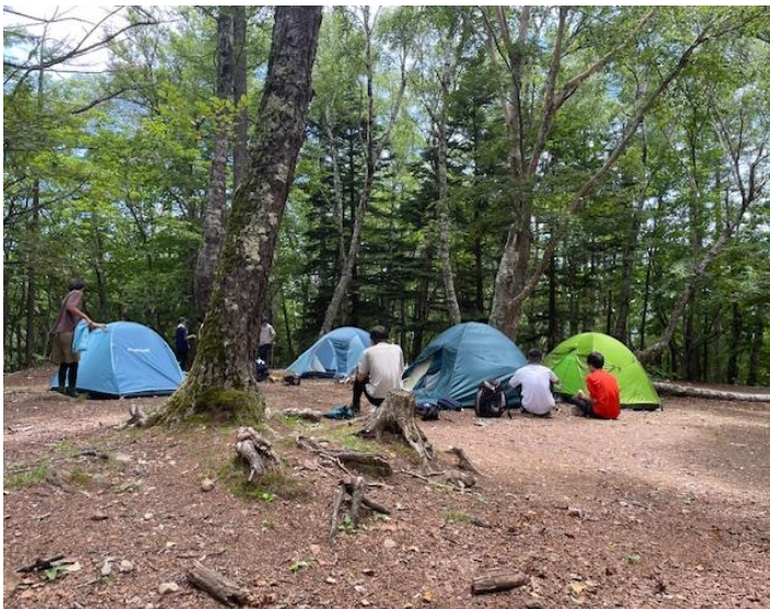
↑ まずはテントの設営からスタート

1日目行程：朝7時八王子駅集合 — 韮崎駅 — みずがき山荘 — 富士見平小屋(合宿の拠点)