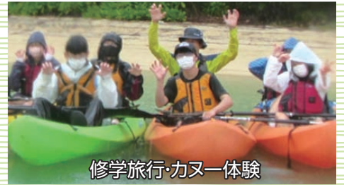
修学旅行・カヌー体験