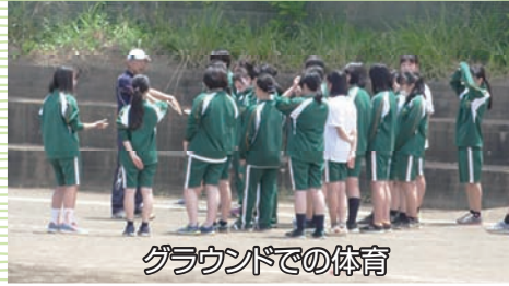
グラウンドでの体育