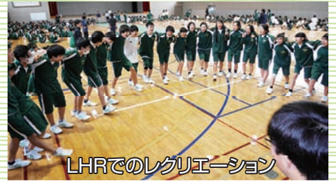
LHRでのレグリエーション