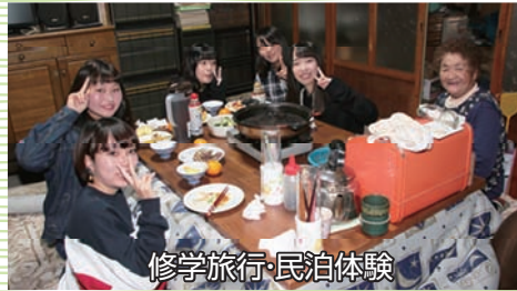
修学旅行・民泊体験