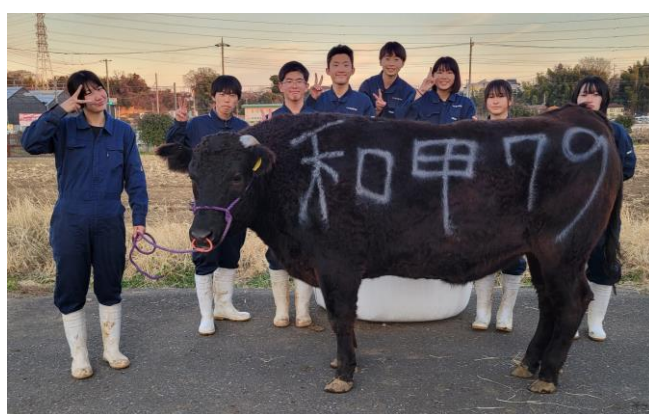
出荷前の記念写真