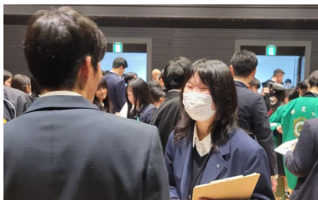
他校の生徒との交流