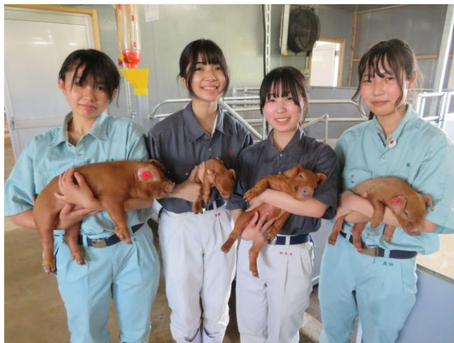
養豚専門研究部の生徒と「ちゅうのとん」