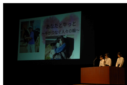
プロジェクト発表会の様子