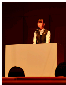
意見発表会の様子