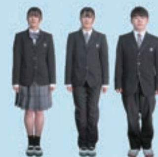
【 制 服 】