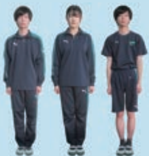
【ジャージ・体育着】