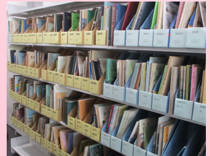
県内公立学校 周年誌