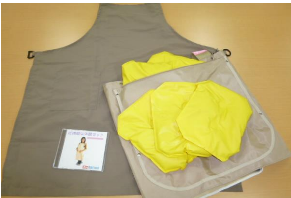
③妊婦疑似体験砂袋セット