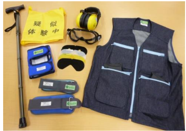
②高齢者疑似体験デラックスセット