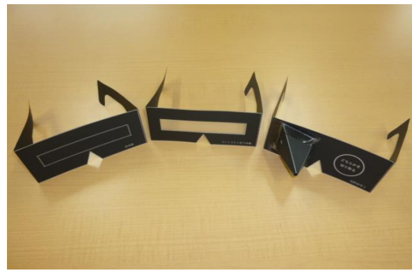
⑤ロービジョン体験キット