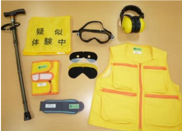
①高齢者疑似体験キッズセット