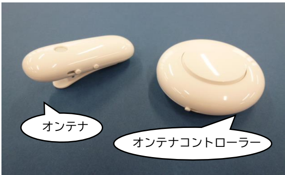
⑥音をからだで感じる「オンテナ」