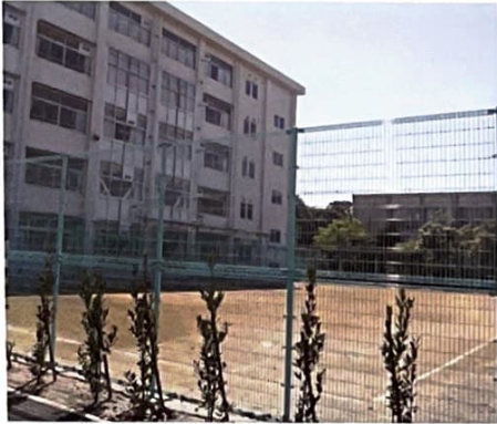
多目的コート&西棟