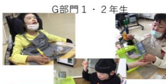
ペットボトル、受注、紙漉き

今回は現場実習に行く生徒やプログラミングを学習する生徒もいて、スポンジとスタンレーに割く時間がいつもよりも少なかったのですが、スポンジ750個、スタンレーは1日で1400個終わらせることができ、丁寧さも速さも増しています。