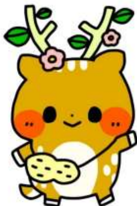
秦野支援学校 イメージキャラクター いぶぎちゃん