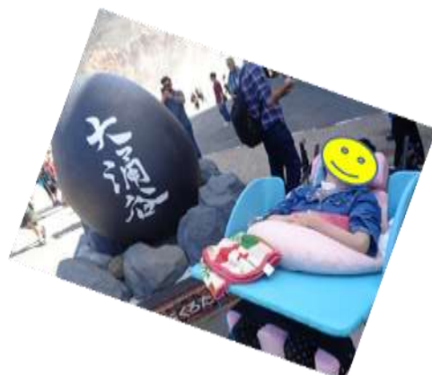
〈令和5年度修学旅行の様子〉