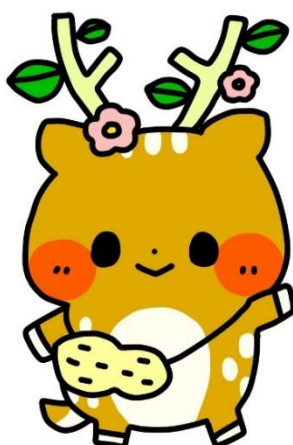
秦野支援学校 イメージキャラクター いぶきちゃん