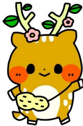
秦野支援学校 イメージキャラクター いぶきちゃん