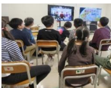
オンライン 交流の様子

閉会式には、代表の児童生徒が参加しました。高等部の司会の生徒に、いぶき祭の感想を聞かれると、「楽しかった！」とみんなで答えることもでき、行事の特別感を味わうことができました。