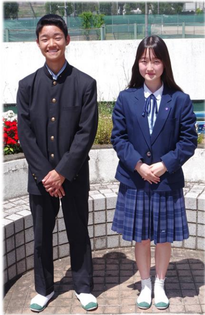
Winter Style 冬のスタイル