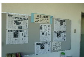
11月7日は、1面の紙面が揃いました。

本校では、おもに前期課程の社会科の授業を中心に新聞を活用した学習を展開しています。教室の近くに、複数の新聞を掲示し、一目で見比べられるような工夫をしています。