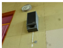
更新前のスピーカー