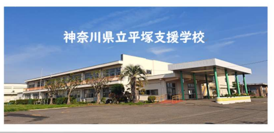
神奈川県立平塚支援学校