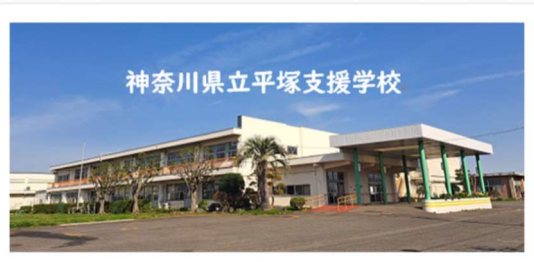
神奈川県立平塚支援学校