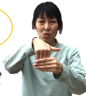
(「テ型」を中に入れるイメージで)