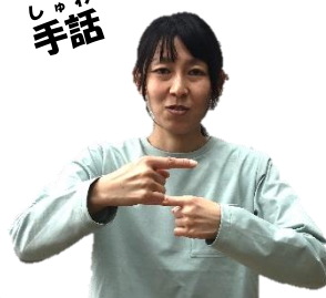
(上下に回転させる)