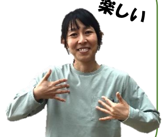
(交互に上下に動かす)