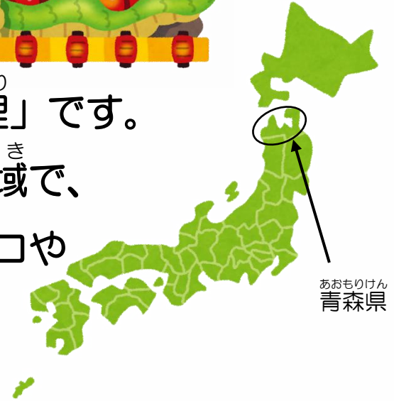
あおもりけん 青森県