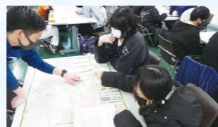
グループワークの様子②