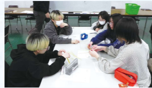
グループワークの様子①