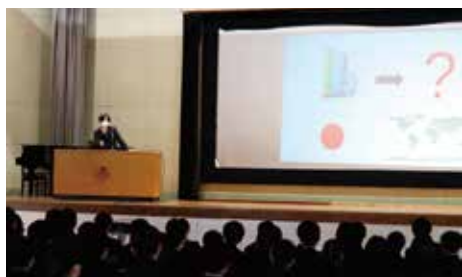
■ スピーチフェスティバル