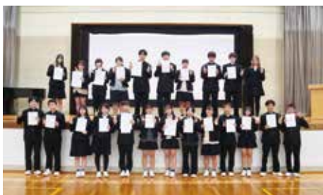
■ スピーチフェスティバル