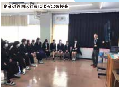
企業の外国人社員による出張授業