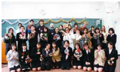
■ 東海大学留学生交流会

異文化への理解を深めるために、少人数での英語の授業を取り入れて、実践的な英語力の向上を目指しています。また、今後海外のフレンドシップ校への訪問も計画しています。