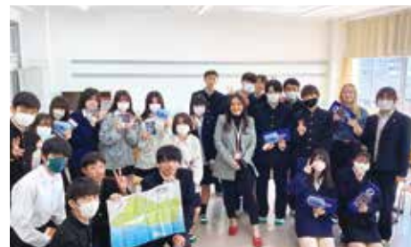
■ 英語による日産テクニカルセンターとの提携授業