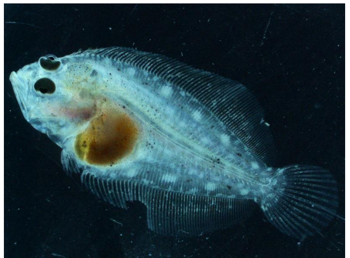
どこから見てもヒラメです！