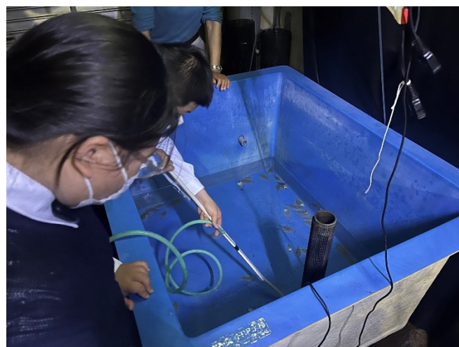
給餌前に底にたまった糞や餌をホースで吸い取ります