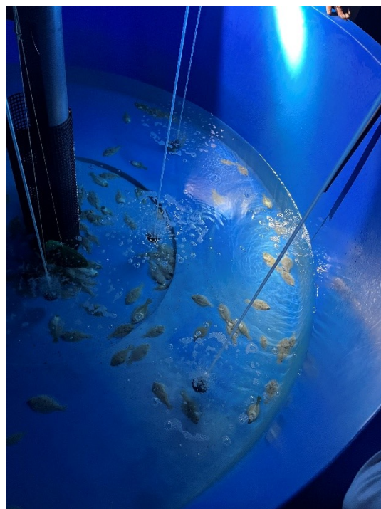
大きな水槽に移し、餌も大きくしたら急成長しました