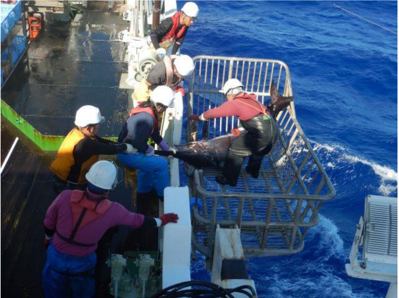
100 kg以上のメカジキと対決