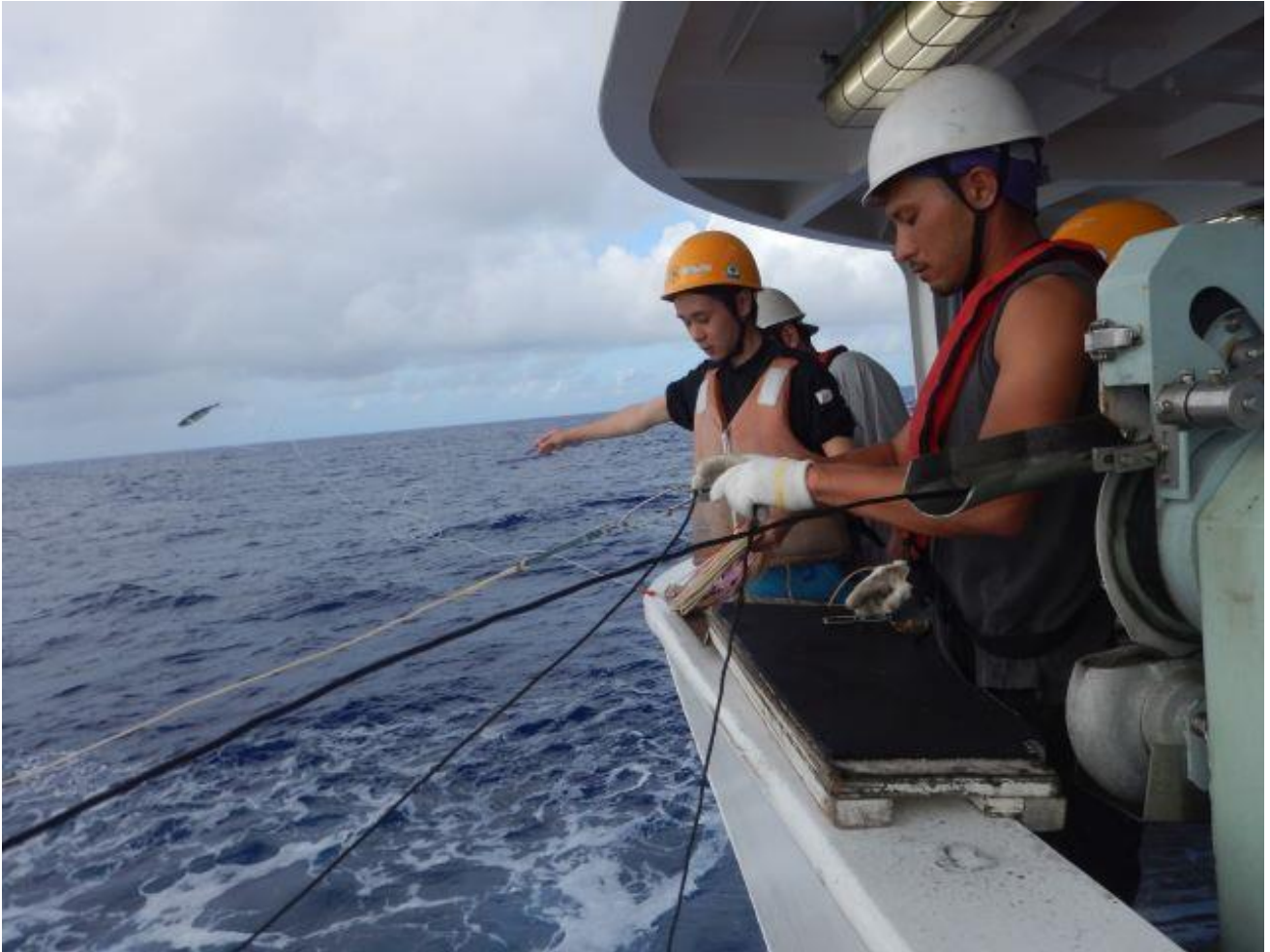
餌投げの様子。自分が投げたところで魚が釣れると嬉しい！！