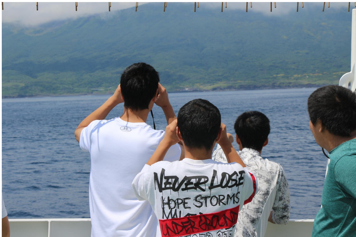
双眼鏡で食い入るように島を見る