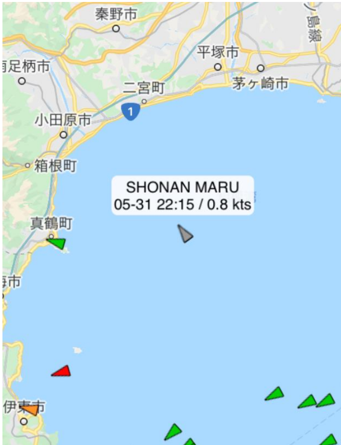
5/31 22時15分 相模湾沖で漂泊中