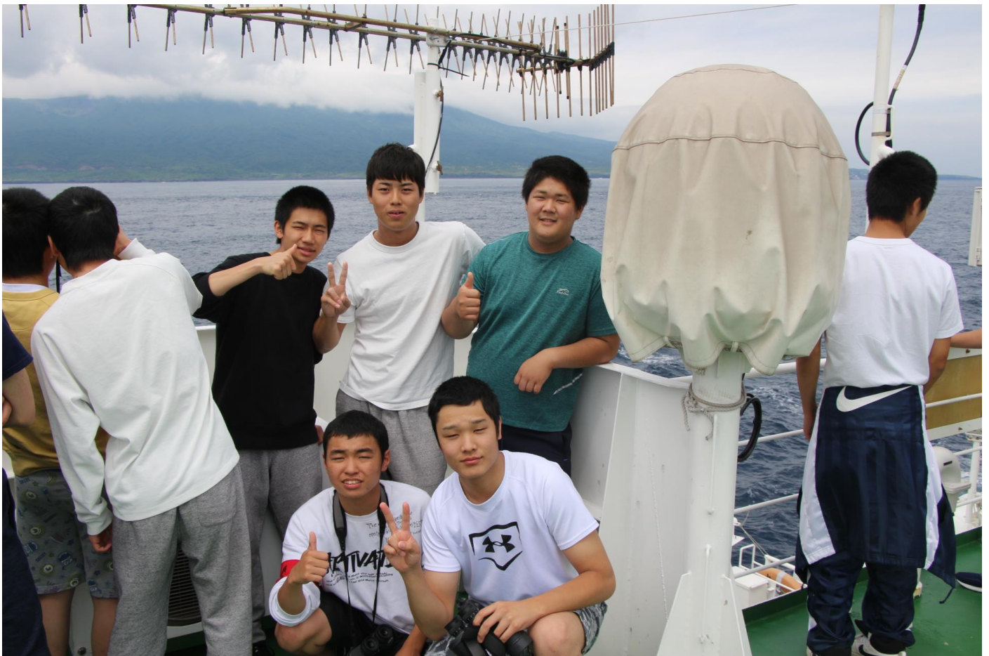
久しぶりの陸地にテンションが上がります

また、本日は久しぶりに島(陸地)を見ることができました。島の近くには黒潮が流れているため、一時的に水温が高い状態になりました。みんな、双眼鏡を使い食い入るように島を見ていました。明日、三崎港に寄港します。|