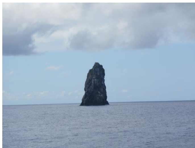
海上にポツンと現れる孀婦岩