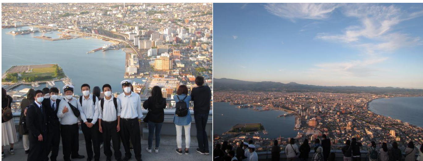
函館山展望台より

本日は一日、上陸許可とし、自由行動で函館を満喫したそうです。夜は、函館の夜景ツアーに参加し、日本三大夜景の一つとされる函館の夜景を楽しんだようです。明日も一日、上陸許可です。