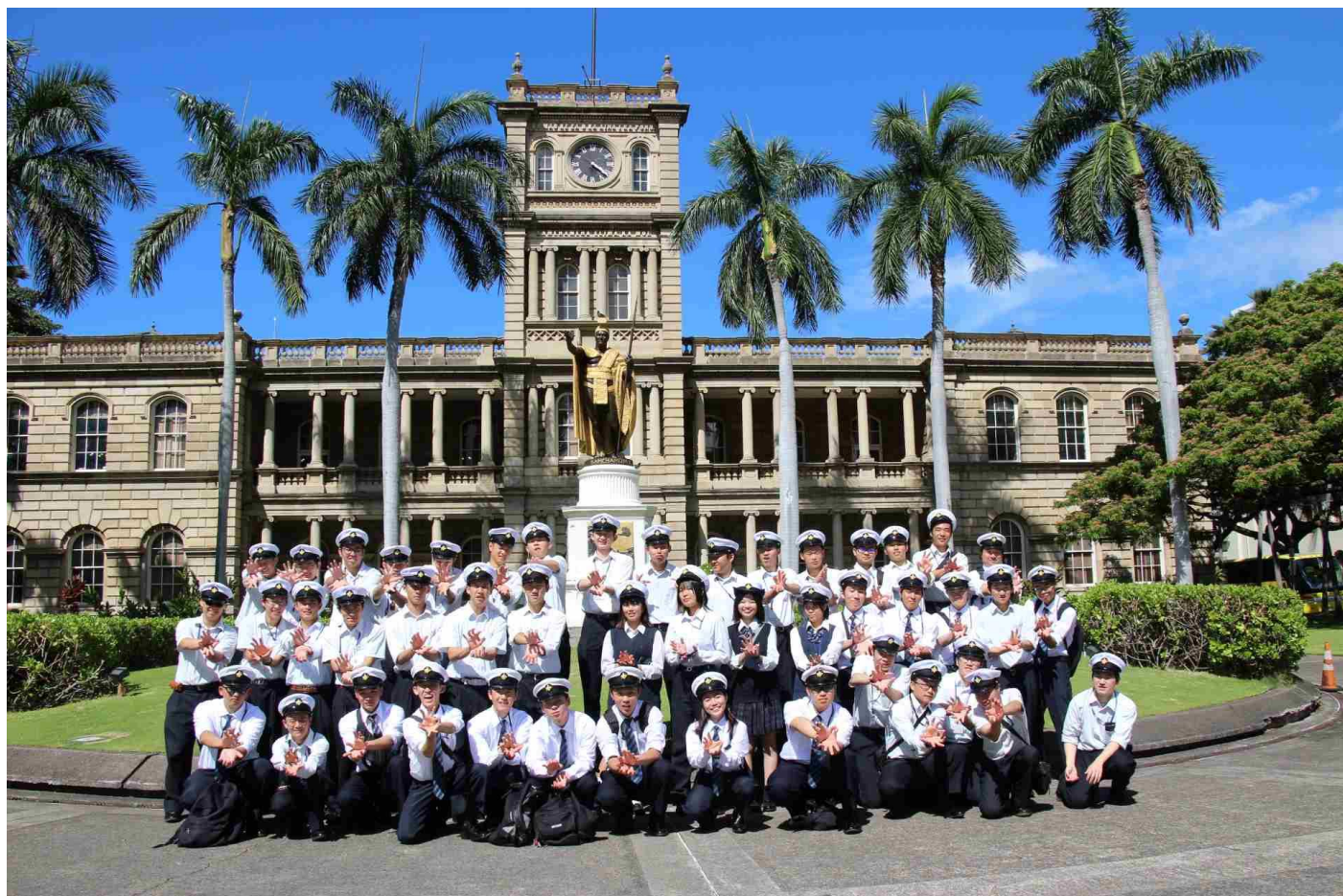
カメハメハ大王の前でカメハメポーズ