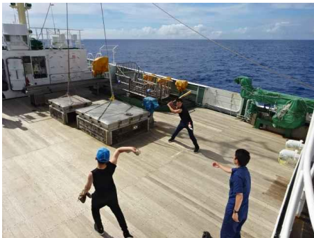
キャッチボールでリフレッシュタイム