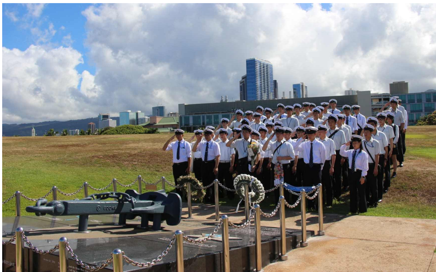
えひめ丸の慰霊碑に花や千羽鶴を手向けました