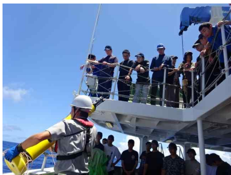
アルゴフロート（調査機器）を海に投下しました