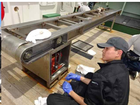
機関系は漁具の片づけ・メンテナンス