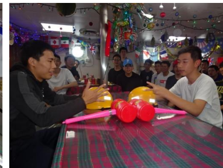
デートライン祭、楽しかった！！