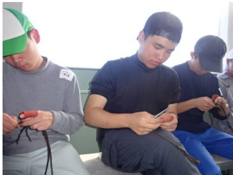
スプライスの実習中