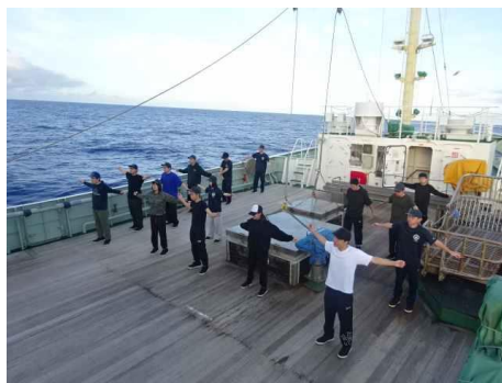
朝、恒例のラジオ体操