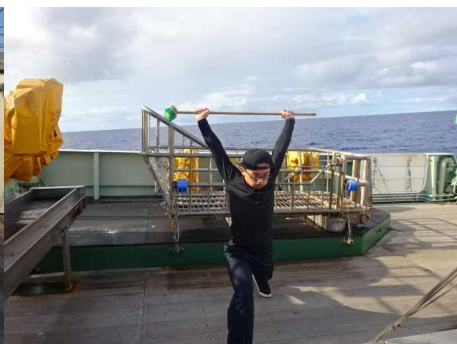
ウェイトリフティングの練習