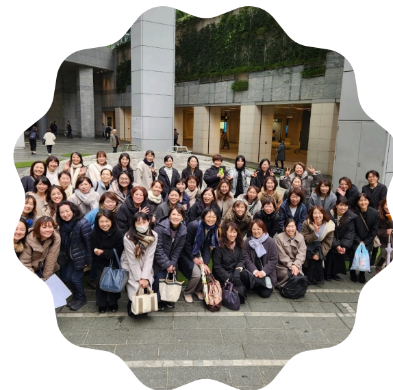
(応募者多数の大人気観劇イベントの様子)