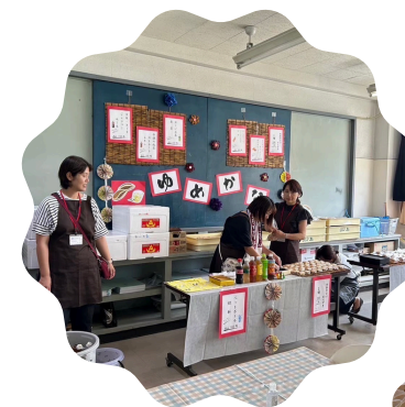
(金井祭出展の様子)