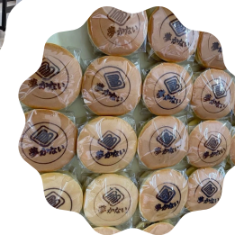
(金井の校章いり 特製どら焼き販売)