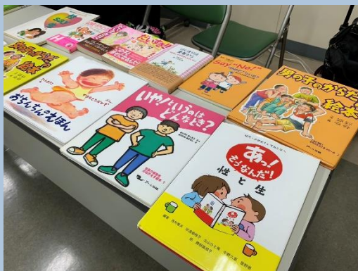
たくさんの参考書や絵本