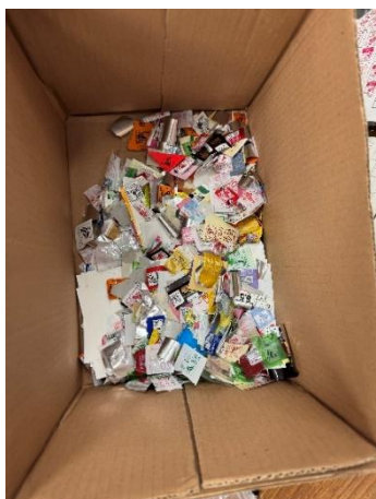
回収されたベルマーク