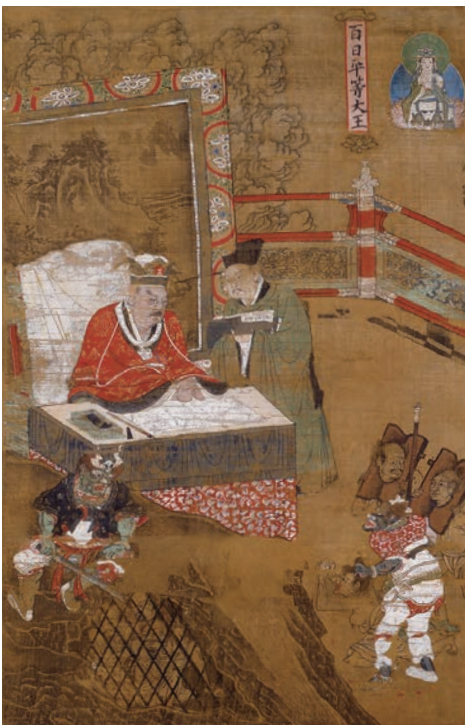
十王図のうち百日平等大王「陸信忠筆」落款元時代