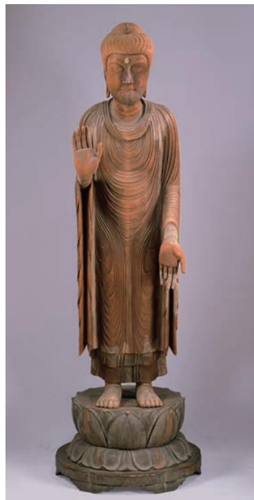
重文 釈迦如来立像 鎌倉時代 徳治三年（1308）