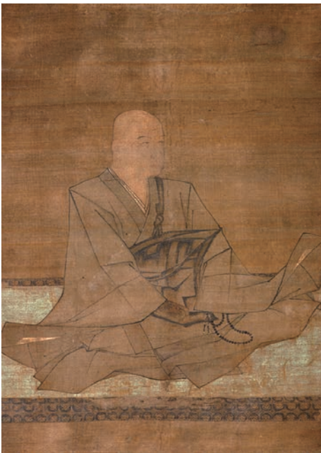
国宝 北条実時像 鎌倉時代

称名寺絵図（部分）鎌倉時代、 称名寺明治絵図（部分）明治末期、 金沢文庫の観光ポスター（部分加工）昭和前期