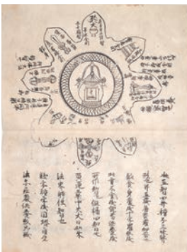
国宝 五蔵曼荼羅和会釈巻下 鎌倉時代