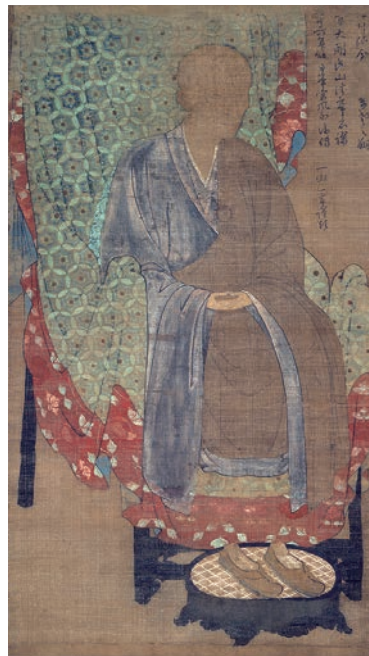
重文 審海像 鎌倉時代