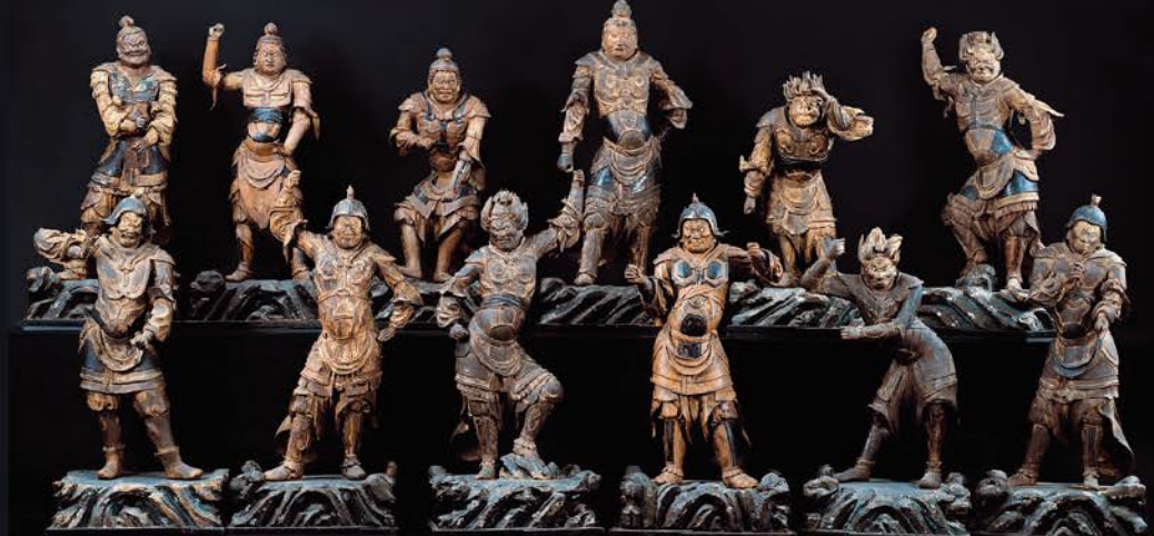
十二神将立像 曹源寺(神奈川) 重要文化財 運慶工房作の十二神将立像を一挙公開