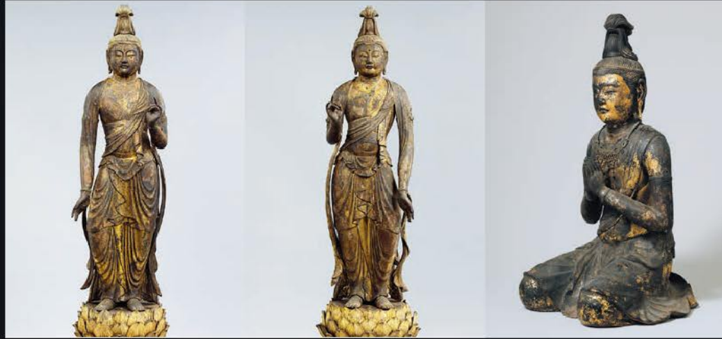
観音・勢至菩薩立像 清水寺(京都) 重要文化財 京都における鎌倉時代初期の運慶工房作とみられる