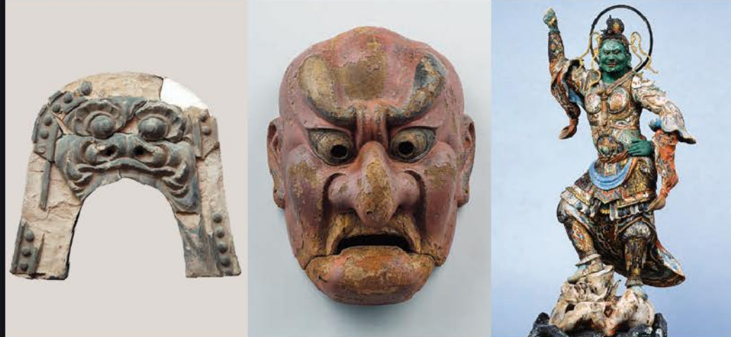
鬼瓦 鎌倉市教育委員会 鎌倉永福寺出土で原型は運慶工房作とみられる