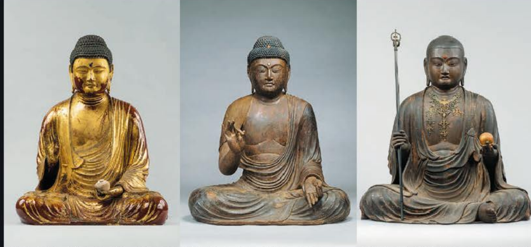
薬師如来坐像 寿福寺(神奈川) 重要文化財 北条政子発願で原型は運慶工房作とみられる