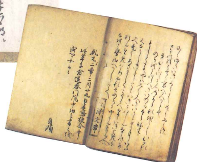
▶重要文化財 たまきはる（奥書・金沢文庫印）神奈川立金沢文庫蔵