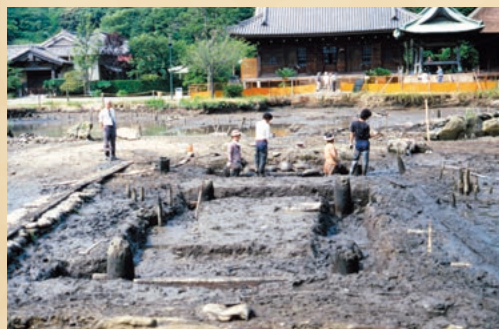
称名寺苑池発掘の様子