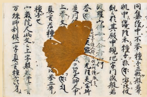
国宝『薄草紙口決』第五