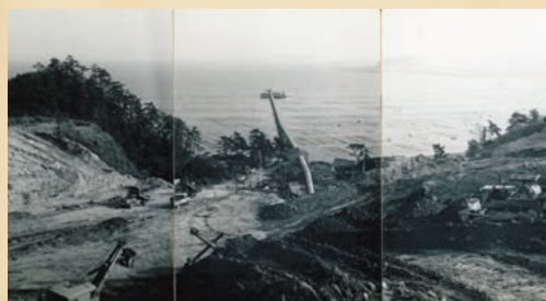
称名寺裏山開発の様子