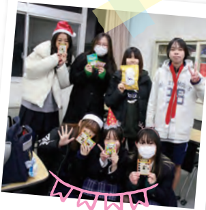
生徒会主催イベント