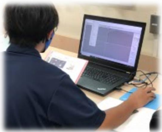
↑プログラミング体験の様子