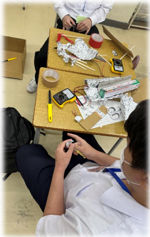
↑ゲームコントローラーの製作の様子