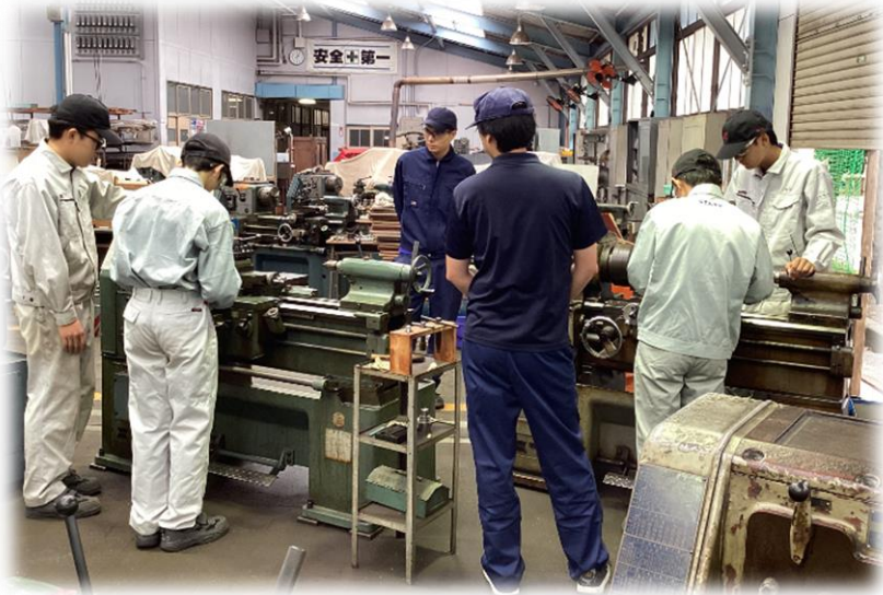
↑コマ作り体験の様子