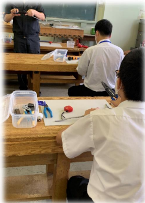
↑電気工事体験の様子