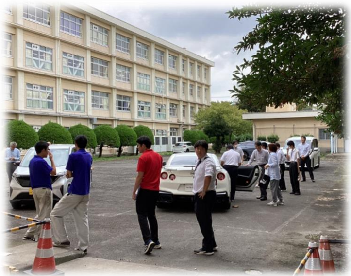
↑自動車について学ぶ様子