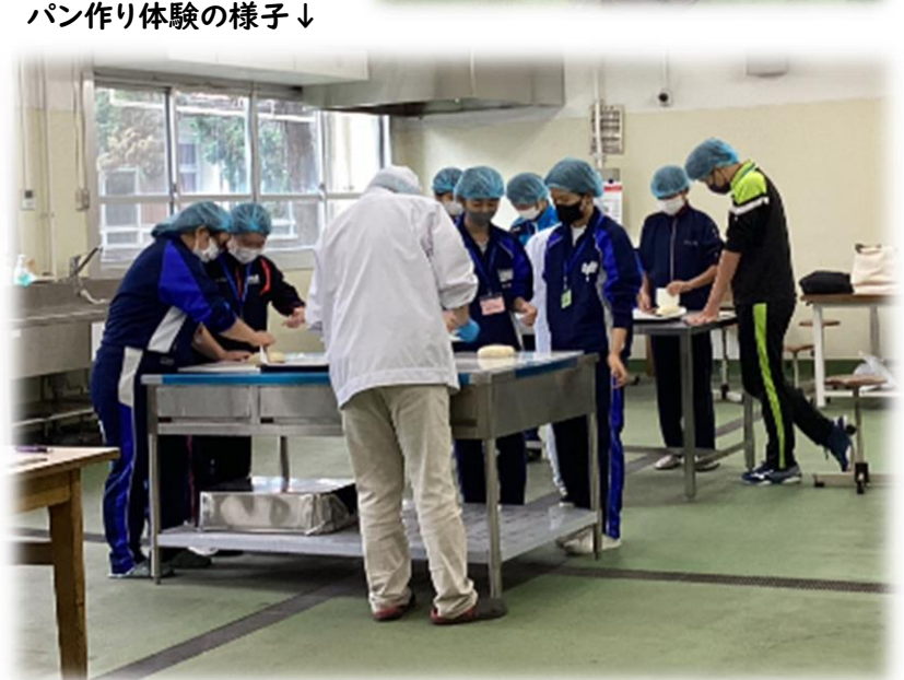
パン作り体験の様子↓